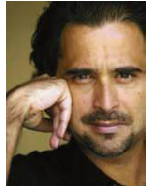
José Eduardo Agualusa (1960)