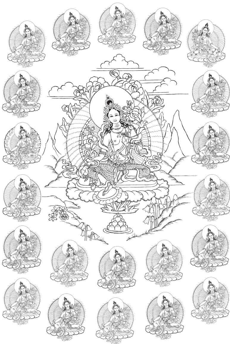
Las veintiuna Taras