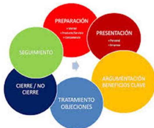
Ilustración 15: Etapas en el proceso de ventas