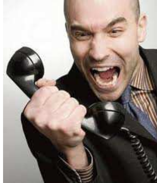
Ilustración 40: La importancia de mantener la calma frente a un reclamo

Las reclamaciones hay que analizarlas y tratarlas informáticamente para extraer de ellas las ratios pertinentes, así como la opinión que tienen nuestros clientes de nosotros. Su análisis y valoración nos dará una información que, si está bien tratada, será muy útil para la compañía. Resulta muy importante trabajar sobre los reclamos, de forma tal de poder descubrir su fuente generadora y poder solucionarlo para el futuro.