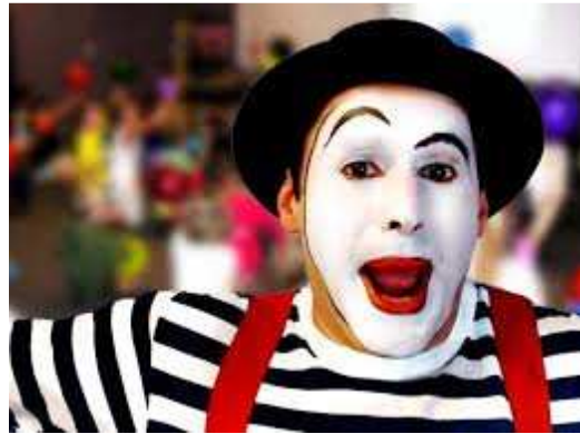
Ilustración 3: Lenguaje No Verbal

La comunicación no verbal es todo aquel lenguaje que surge del cuerpo y que no depende de las palabras que se dicen. En muchas ocasiones nuestro cerebro va más rápido que nuestras palabras, y expresa cosas que no queremos decir o refuerza lo que queremos expresar.