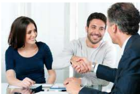
Ilustración 16: Ponerse en el lugar del cliente

Al emplear la teoría de venta referente a la pura satisfacción de las necesidades, el vendedor debe conocer perfectamente el punto de vista del cliente, orientándolo hacia él, y la mejor forma para ello es interesándose por sus necesidades o deseos