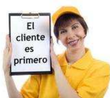
Ilustración 39: Servicio de Atención al Cliente

Los empresarios saben que el costo de mantenimiento de un cliente es notablemente inferior al costo de conseguir uno nuevo y a su vez sensiblemente menor al de recuperación de un cliente perdido. Entonces, ¿por qué no potenciar ya una cultura de atención al cliente que nos permita fidelizarlos? Utilicemos el marketing relacional.