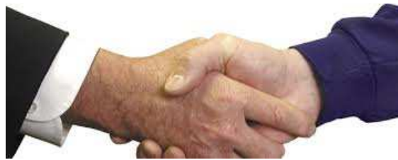
Ilustración 26: Un buen cierre equivale a un buen acuerdo

Todo cuanto el vendedor ha hecho hasta este momento tiene un sólo objetivo: cerrar la venta y concretar la operación. Es decir, lograr el pedido o al menos conseguir un compromiso formal. En realidad se empieza a cerrar en la etapa de preparación, cuando en casa o en el despacho se planifica bien la entrevista de venta. Continúa en la etapa de apertura o contacto con el cliente, para seguir en la etapa de determinación de necesidades, donde es fundamental que se hayan sabido plantear las preguntas adecuadas y averiguado necesidades o motivaciones específicas del cliente.