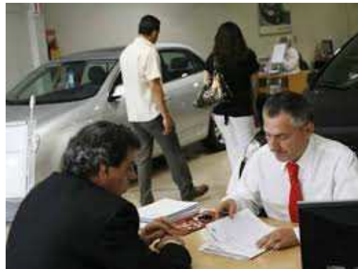
Ilustración 14: Vendedor de Autos

Uno de los sistemas más clásicos de venta que tuvo gran éxito, e incluso hoy en día tiene vigencia, es la venta a través del método AIDDA que, en el año 1947, Percy H. Whaiting presentó en su libro Las cinco grandes reglas de la venta , cuya importancia ha sido trascendental en la historia de las técnicas de venta.