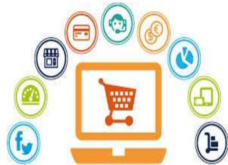
Ilustración 29: Proceso del e-commerce

Gestión del conocimiento. Enfoque estratégico en la gestión comercial, donde el marketing adquiere gran importancia.