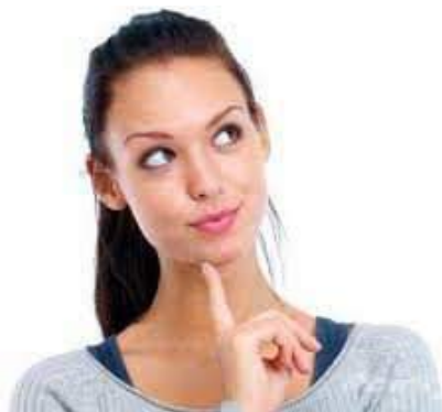
Ilustración 37: El cliente no nos dice sus necesidades

Una vez que el vendedor ha descubierto alguna necesidad o deseo de su cliente, que puede ser satisfecho con beneficios o ventajas de su producto, éste presentará esos beneficios como argumentos de venta. Ahora bien, hay que tener en cuenta que los productos no se venden por lo que son, sino por lo que pueden hacer por el cliente, es decir: por la utilidad que le reportarán, cómo le ayudarán en su trabajo o las satisfacciones que le proporcionarán. En realidad a pocas personas les interesa de qué están fabricados, quien los ha inventado, o cómo están elaborados los productos, es decir, sus características, a no ser que eso represente una ventaja con respecto a lo que hasta ese momento había en el mercado.