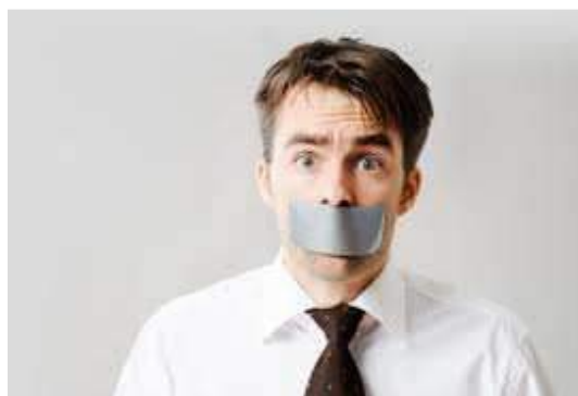
Ilustración 21: La importancia del Silencio

El silencio también es una poderosa herramienta de comunicación, demuestra atención total a quien está hablando, descarta toda posibilidad de crear barreras y ejerce una suave presión sobre el que habla para que continúe haciéndolo. No es cuestión de convertir a los vendedores en mudos, sino simplemente hacer que hablen en el momento oportuno y escuchar para dominar el diálogo. Hay un proverbio que dice: «El oído puede ayudar tanto como la boca a conseguir la venta». El buen vendedor debe saber escuchar con la intención de averiguar las auténticas necesidades del cliente y sus deseos y, de esta forma, descubrir los obstáculos que tendrá que superar antes de realizar su venta.