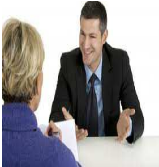
Ilustración 30: Una buena negociación, la clave

Generalmente, en la negociación no resulta afectada la relación total entre los participantes, se difiere en una parte, no en el todo. Las fases de la negociación son muy parecidas a las de la venta; del conocimiento y dominio de estas fases va a depender en gran medida el éxito o fracaso en la negociación.