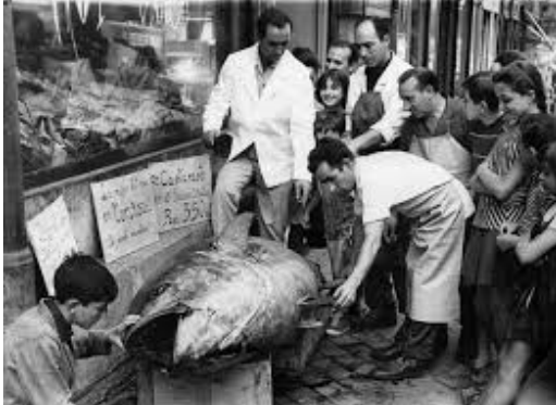
Ilustración 10: Venta en la calle