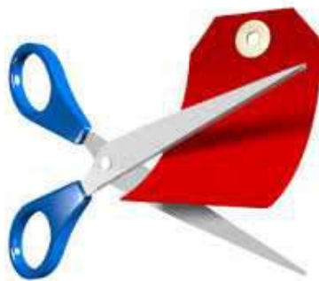
Ilustración 34: Fraccionar el precio

Ejemplo: «esta magnífica enciclopedia le costará menos que la compra de un periódico diariamente».