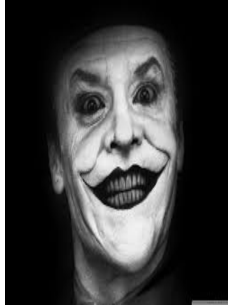
Ilustración 35: Los compradores también usan sus técnicas

«Con los productos muy baratos se suelen necesitar pocos argumentos para venderlos, pero muchos para atender las reclamaciones.»