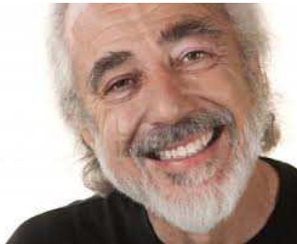
Ilustración 41: Lo que todos buscamos, la completa satisfacción del cliente

-Las reclamaciones son una fuente de información y fidelización de los clientes, aprovechémoslas.