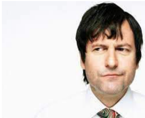
Ilustración 23: Objeciones, no estoy del todo de acuerdo

Podemos definir la objeción como una oposición momentánea a la argumentación de venta. No siempre esto es negativo; por el contrario, las objeciones en la mayoría de las ocasiones ayudan a decidirse al cliente, pues casi siempre están generadas por dudas o por una información incompleta.