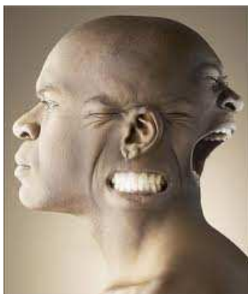
Ilustración 38: Si la ventas bajan, nunca desesperarse

Lo primero que debemos hacer es dimensionar y aislar el problema, es decir, descubrir dónde ha ocurrido y en qué medida. Hay que determinar si ha disminuido el número de unidades vendidas, el volumen de facturación en todas las gamas. En qué segmento o zona de clientes se ha producido, en qué productos y finalmente en qué vendedores, zonas geográficas o unidades de negocio se ha producido.