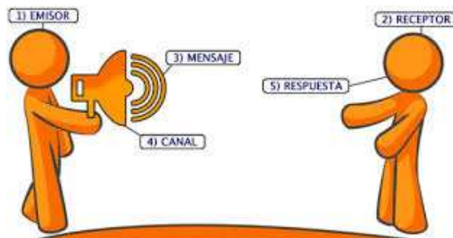
Ilustración 1: Proceso de Comunicación

Código: son las distintas formas y estilos que tiene el vendedor de transmitir el mensaje. Nos referidos al idioma, más coloquial, juvenil, técnica, en primera persona, entre otros.