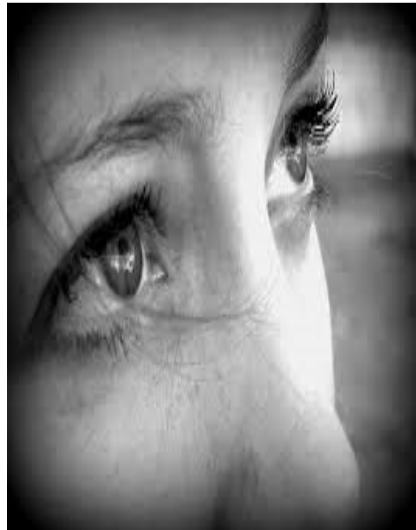
Ilustración 4: La mirada una herramienta clave

Por norma general, cuando una persona está escuchando, mira a los ojos de la otra persona de forma continuada. Por tanto, como profesionales de la venta se tiene que mirar continuamente a los ojos de los clientes, porque si no sentirán que no están siendo escuchados. No es recomendable que el vendedor tenga una mirada provocativa hacia su interlocutor o interlocutora, ya que generará una reacción defensiva por su accionar. Una mirada penetrante tampoco es recomendable, lo bueno es siempre tratar de actuar con un elemento (bolígrafo) que resalta la importancia hacia un elemento que obligue su mirada.