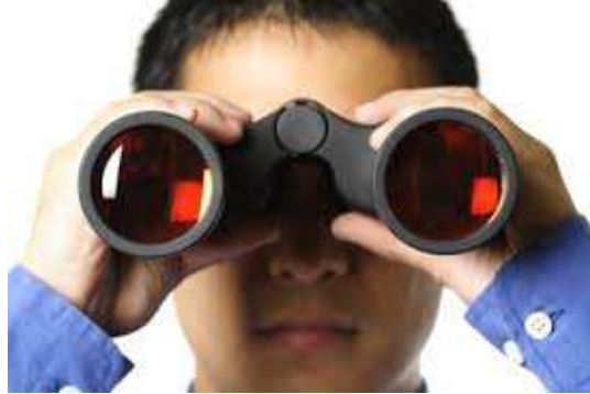
Ilustración 20: La importancia de descubrir las necesidades

Preguntar parece muy sencillo, pero no es así, saber formular la pregunta inteligente y adecuarla a las diferentes personalidades, conseguir información de un cliente silencioso o por el contrario centrar bien el tema con los que hablan demasiado, para evitar que se dispersen, tratar de no influenciar la respuesta del interlocutor o condicionarla, según convenga para la gestión de ventas, es fruto de una gran habilidad.