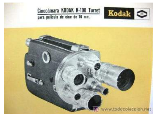
Ilustración 13: Productos de 1970

Las técnicas son herramientas, instrumentos que se aplican en el proceso de venta para persuadir al cliente o posible cliente hacia la propuesta del vendedor. La mayoría están