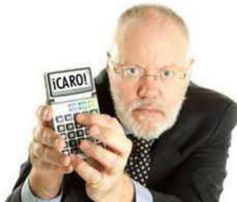
Ilustración 24: Ejemplo de Objeción

Cuando un cliente no se cree un beneficio del producto es porque en realidad el vendedor no ha sabido argumentar y demostrar las soluciones, por ello debe volverlo a intentar reflexionando sobre las necesidades expresadas por el cliente. A partir de ese momento tendrá muchas más posibilidades de «cerrar» con éxito.