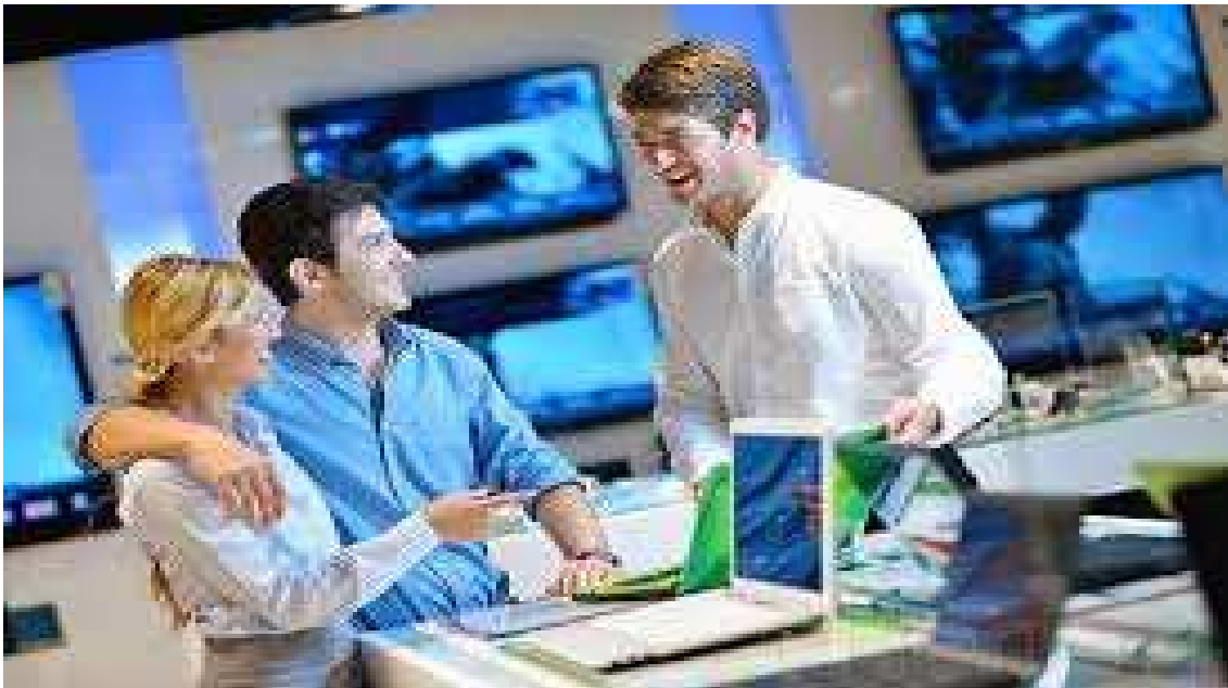
Ilustración 2: Vendedor de Electrodomésticos

Por último, es importante evitar la falsa confianza y la falsa humildad. En este sentido, hay que tener muy claro que «si el receptor no entiende es culpa del emisor». O sea, según este principio, nunca se debe decir: «es que usted no me entiende», sino «he debido explicarme mal».