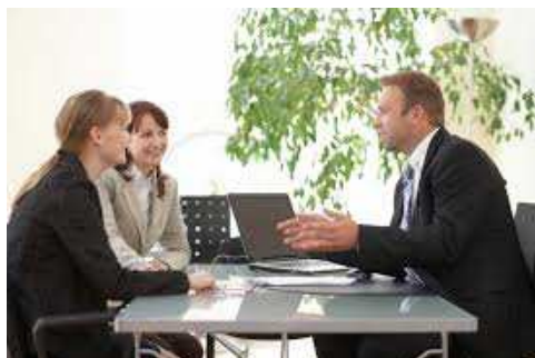
Ilustración 28: La importancia de un buen cierre

Si durante todo el proceso de compraventa se tiene que saber escuchar, donde cobra una mayor importancia es en la etapa del cierre, el vendedor debe concentrarse en comprender todo lo que el cliente dice y todo lo que quiere decir «entre líneas». En esta fase es decisiva la técnica del silencio, si el vendedor ha planteado una pregunta para que su cliente se comprometa, deberá esperar el tiempo que sea necesario hasta que le conteste, a veces parecen siglos, pero es la mejor fórmula para ejercer una «suave presión» que haga decidirse al cliente.