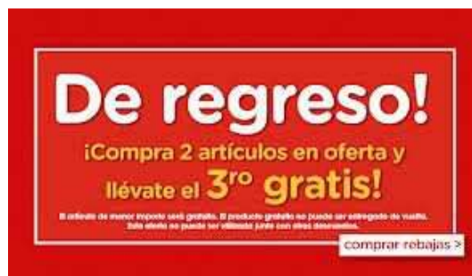
Ilustración 36: Promociones por cantidades

Debido a su gran interés de cara al planteamiento de estrategias y toma de decisiones mediante la colaboración de psicólogos que estudian la conducta humana, se han realizado numerosas investigaciones sobre el comportamiento de los compradores que demuestran que éstos compran más, probablemente motivados por la existencia consciente de necesidades explícitas, es decir, específicas, y también cuando el vendedor realiza ofertas que suponen un beneficio adicional, o así es percibido por el comprador. Esto está relacionado con las promociones por volumen.