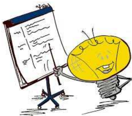
Ilustración 22: Técnicas de Argumentación

La fase de argumentación es indispensable dentro del proceso de negociación. En realidad, el trabajo del vendedor consiste en hacer que el cliente perciba las diferencias que tienen sus productos frente a los de sus competidores. Esto se logrará presentando los argumentos adecuados y dimensionando los beneficios de su producto o servicio. Ahora bien, debe presentarlos en el momento adecuado; es decir, después de conocer las necesidades y motivaciones o móviles de compra del interlocutor y no antes.