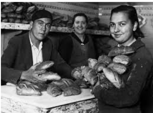
Ilustración 12: Venta después de la Guerra

El vendedor profesional aún sigue siendo en el siglo XXI la punta de lanza del futuro de las empresas, y ellos determinan parte de su éxito. El siglo XX experimentó profundos cambios dentro del mundo de la venta; hace más de 55 años no era difícil vender, ya que la mayoría de los países habían pasado una guerra y una posguerra, la escasez de casi todos los productos, fundamentalmente de los básicos, era casi la norma. En estas condiciones la gente compraba lo que le ofrecieran sin tener que realizar complicados procesos de elección. Es a partir de los años 50, con la fabricación en cadena y la proliferación de productos y servicios, cuando comienzan en Europa a utilizarse algunas técnicas de venta que, generalmente, venían importadas de los EE UU.