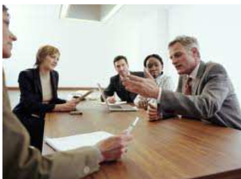
Ilustración 31: Decir claramente los puntos para acordar

Es como en el lenguaje futbolero sería marcar la cancha, de forma de tal de poder expresar en forma bien clara el punto de desacuerdo.