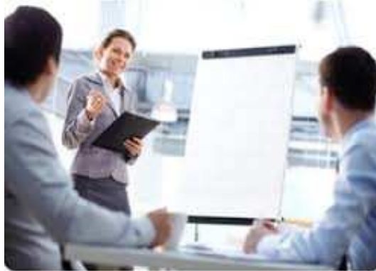
Ilustración 19: Práctica de una Entrevista

El vendedor deberá trazarse un objetivo específico para cada gestión de venta. Un objetivo es una meta que hay que alcanzar en un plazo determinado. Debe ser ambicioso, pero realizable, mensurable y, desde luego, compatible con los objetivos generales de la empresa.