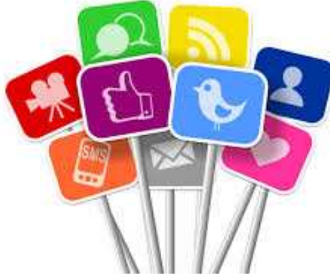
Ilustración 18: Medios de Comunicación con los Clientes

se asignará la frecuencia de visitas en función de esos parámetros. Naturalmente, los clientes «A» y «B» tendrán una frecuencia mayor que los «C».