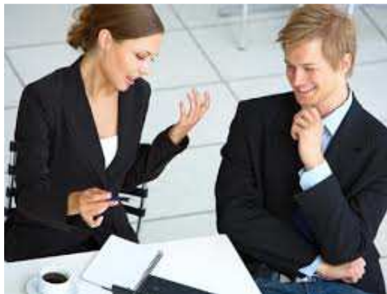
Ilustración 17: Vendedora aplicando una técnica

Como he comentado anteriormente, el vendedor profesional debe seguir una metodología o una estructura en su trabajo. Esto tiene la ventaja para él de saber dónde se encuentra en todo momento durante la entrevista para poder subir y avanzar por los distintos escalones de la venta, lo que le ayudará a conseguir el éxito. Lo más importante en el concepto de estructura de la venta es la flexibilidad y sobre todo tener el control de la situación, en función al análisis del cliente y del momento, con el objetivo de poder aplicar cada una de las estrategias en tiempo y forma, con el objetivo final de conseguir la venta.