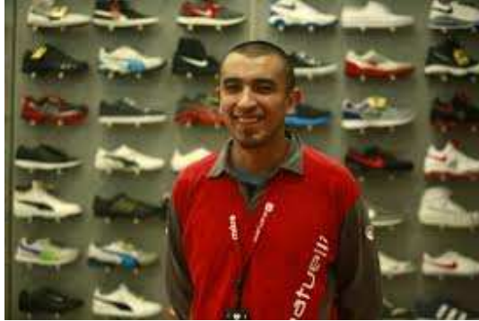
Ilustración 8: La indumentaria correcta

La vestimenta utilizada debe tener sintonía con el o los productos que el vendedor ofrecer, tal como lo vemos en la ilustración en una tienda deportiva lo más lógico para que tenga mayor armonía con el cliente es que vista con ropa deportiva informal, eso le resultará más cómodo al vendedor y logrará una sintonía fina con el tipo de cliente que demanda dichos productos. Cuando hablamos de productos farmacéuticos, lo recomendable es que sea con cierta formalidad (impecable traje y corbata) ya que debe dar una imagen de alta profesionalidad y consonancia con el profesional que visita.