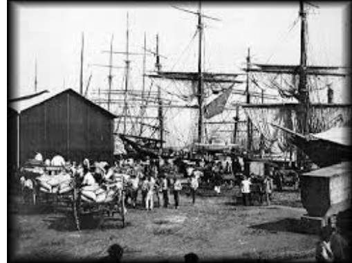
Ilustración 11: El comercio en los puertos

Gracias a la venta y a los que ejercían tan digna profesión se han producido avances tecnológicos y se han facilitado cambios, propiciados por aquellos vendedores que a la vez eran inventores hasta llegar a uno de sus mejores exponentes como fue Henry Ford, que facilitó un gran impulso a la economía de los países.