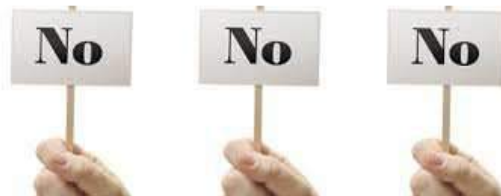
Ilustración 25: Objeciones

El cliente menciona desventajas de su producto, que pueden ser el resultado de que su producto no ofrezca un beneficio que el cliente considera importante o hay algo en él que le desagrada, casi siempre suele ser el precio; si se trata de un medicamento, sus efectos secundarios, cuando se trata de objetos voluminosos, el espacio que ocupa en la estantería, etc.