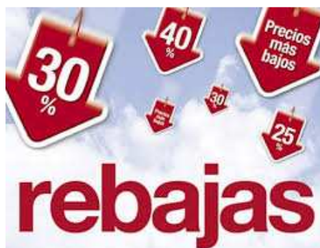
Ilustración 33: Las promociones reducen el precio

Los clientes suelen decir: «es muy caro...», cuando en realidad deberían decir: «no veo el valor...» o «es un precio muy elevado».