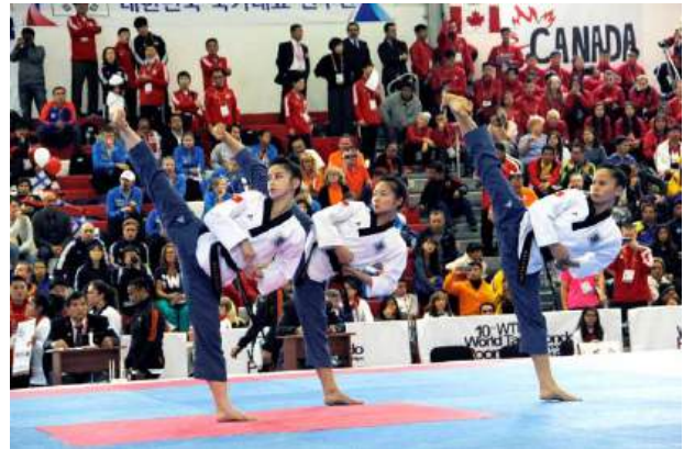
Figura 7. Competidores realizando un Poomsae por equipos. Por WTF, 2016, http://www.worldtaekwondo.org/wp-content/uploads/2016/09/MG_0223-%EB%B3%B5%EC%82%AC%EB%B3%B8-copy.jpg

Como conclusión al apartado de formas podemos decir que las diferencias entre federaciones son abismales. El objetivo de ambas sin embargo es el mismo, la práctica de las técnicas sin necesidad de un oponente. También cabe recordar que nos encontramos ante un arte marcial, y la práctica de las formas es uno de los puntos esenciales en éstas. Por lo tanto el mantenimiento de la práctica y las competiciones de Tul y Poomsae, en mi opinión, es una forma de mantener la esencia del Taekwondo.