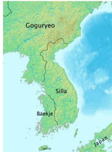
Figura 1. Península de Corea durante la época de los tres reinos.