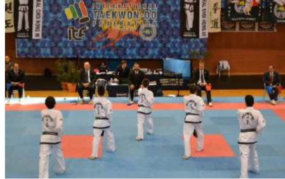
Figura 5. Representantes españoles compitiendo en la categoría del tul por equipos.

Por otro lado nos encontramos con los “Poomsaes”, el apartado de formas que se incluye en la “World Taekwondo Federation”.