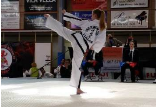
Figura 4. Representante de Italia compitiendo en la categoría de tul individual. Por Taekwondocantabria, 2015, http://www.taekwondocantabria.com/index.php?page=imagenes&c=28&p=1