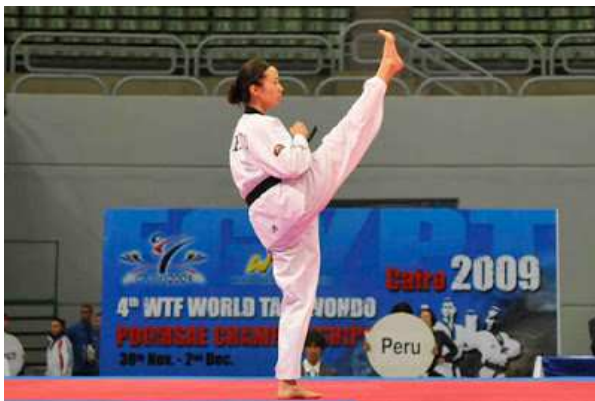
Figura 6. Practicante de Taekwondo ejecutando un Poomsae. 2009, http://taekwondo-wtf-argentina.blogspot.com.es/2009_12_20_archive.html

Del mismo modo que los Tuls, los Poomsaes, además de la aplicación práctica como entrenamiento, también poseían un significado. Los Taegeuks querían transmitir una filosofía relatada en el libro chino “I Ching”, se pretendía utilizar para guiar al practicante en un sentido mental y espiritual al realizar las formas (Yu, et al., 2014). Como antes hemos mencionado, también los Poomsaes de cinturón negro hacen referencia a palabras con determinados significados.