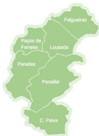
Figura 1: Delimitação geográfica do Vale do Sousa

A região do Vale do Sousa é constituída por 6 concelhos (Castelo de Paiva, Felgueiras, Lousada, Paços de Ferreira, Paredes e Penafiel) e situa-se entre a área metropolitana do Porto e o interior da região Norte (Tâmega). O Vale do Sousa representa 9% da região Norte, o que faz de si, uma das mais habitadas. Para além de possuir uma identidade marcadamente natural, composta por uma rede hidrográfica que recorta vários vales, também, possui uma marca cultural rural que moldaram até aos dias de hoje, o modo de vida desta populações, apesar das mudanças provocadas pela urbanidade e industrialização.