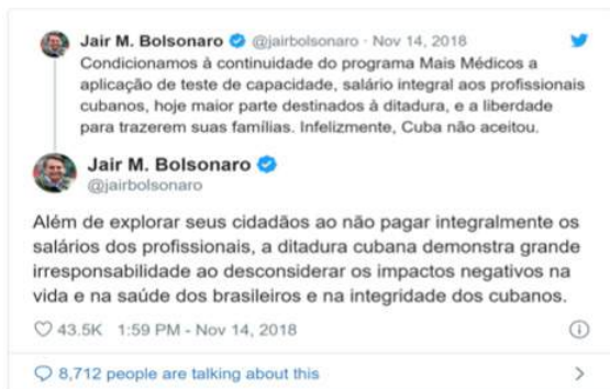
Figura 1: Texto publicado pelo candidato eleito à presidência da república em sua rede social em 14/11/2018