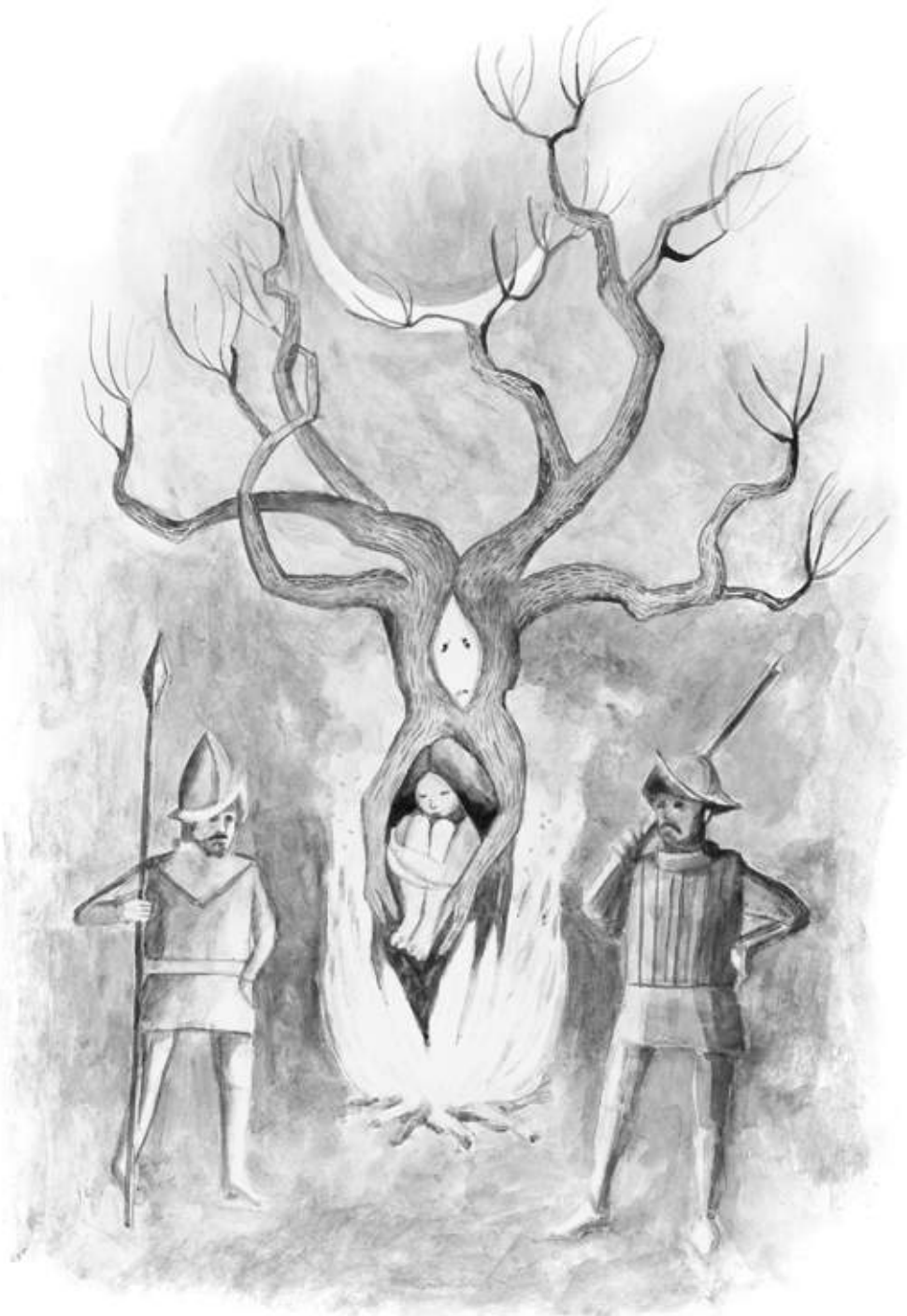
Los españoles ataron a Anahí a un árbol y prendieron fuego, pero el fuego no quemaba