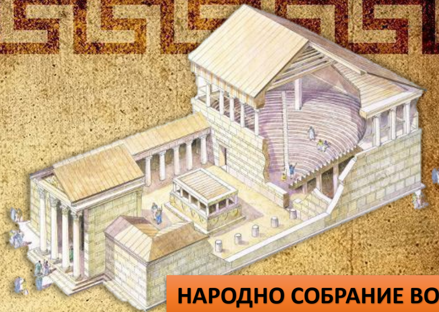
НАРОДНО СОБРАНИЕ ВО АТИНА