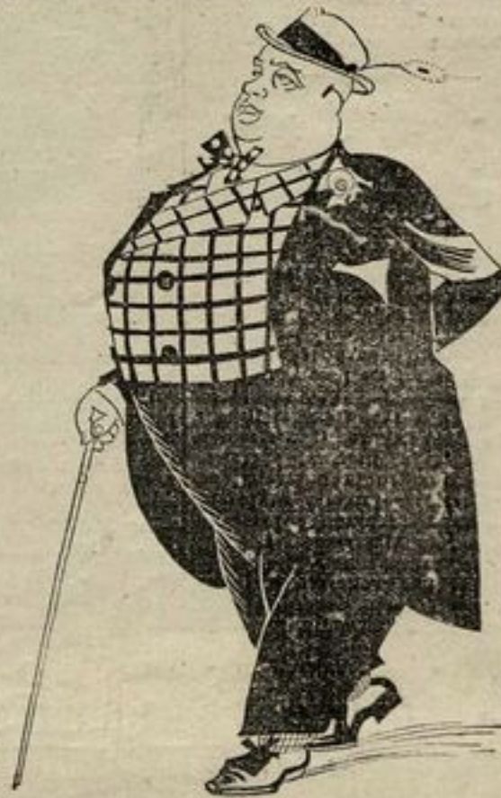
Le encontramos completamente transformado, dispuesto a lanzarse a la vía pública.

—¿Cómo el golpe? ¡El porrazo! Entonces nos decidimos a contemplarle a nuestro sabor. Zapatos de ante mordoré, calcetines de juego de damas,