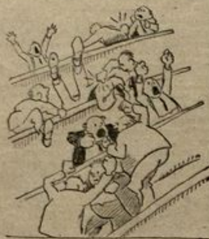
A la hora de la marimorena

Después de la sesión que no se ha celebrado, aunque parecidas se celebran a diario, hemos de referirnos a otras más inverosímiles, que se han plasma-