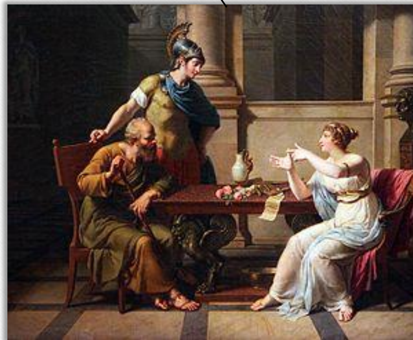
Уметнички приказ на римско семејство