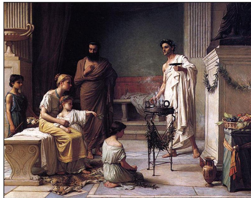
Уметнички приказ на хеленско семејство