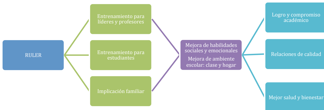
Fig. 3. Programa RULER (Brackett, 2013)

En definitiva, el conjunto de estudios llevados a cabo a lo largo de las últimas décadas, así como las numerosas investigaciones llevadas a la práctica recientemente tanto con niños en escuelas como con directivos en empresas reflejan el claro interés emergente y la incesante apuesta por la importancia de las aptitudes emocionales para lograr ser más eficiente, e incluso para obtener el bienestar personal y social. En otras palabras, cada vez son más los esfuerzos que se están realizando por desarrollar la inteligencia emocional en todos los ámbitos y aplicado a todas las edades.