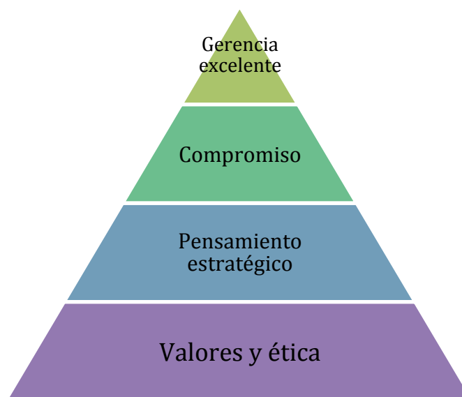
Fig. 1. Pirámide jerárquica de competencias de un líder (Baird & Barrados, 2007)

Por último, el Baird y Barrados (2007) realizaron una publicación para el Gobierno de Canadá para representar, a modo de jerarquía, las competencias clave que ha de poseer un individuo para convertirse en líder. Dicha publicación, representada mediante una pirámide, tenía como fin buscar un perfil concreto para que los departamentos de recursos humanos de las organizaciones canadienses pudiesen integrarlo en su plantilla y poder así desarrollar y llevar a cabo sus planes estratégicos. La pirámide aparece representada a continuación, en la Figura 1: