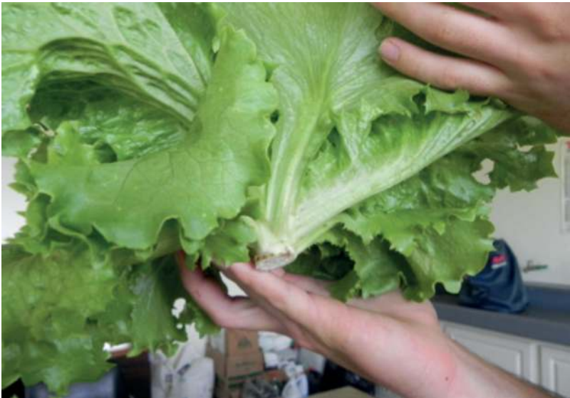
Figura 12. Corte de raíz y escurrido del latex del tallo para evitar daños en las hojas

Una vez anotados los datos anteriores para un posterior análisis, el producto deberá acondicionarse según las indicaciones del cliente y el proceso de comercialización que se seguirá, que pueden incluir la realización de operaciones como lavado, escurrido, empaclado y almacenamiento. Este último, según la variedad de la hortaliza, se acostumbra que sea a temperaturas entre 0 °C y 5 °C con humedades relativas entre el 95 % y el 98 % (UC Davis Postharvest Technology Center, 2014).