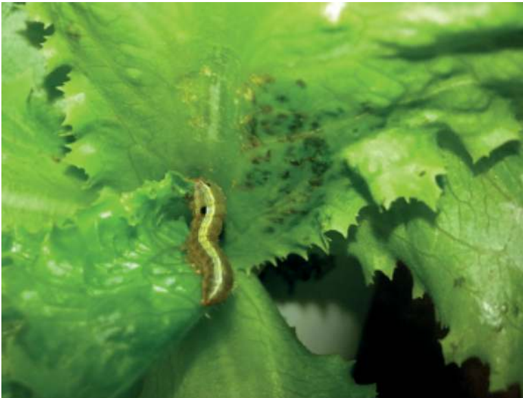
Figura 7. Lechuga con un cortador en sus hojas ( Spodoptera sp.)