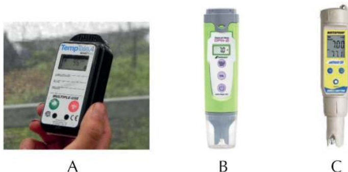
Figura 4. Equipo de monitoreo: A) Datalogger para registro de datos de temperatura y humedad ambiental, B) Conductímetro para monitoreo de conductividad eléctrica-concentración, C) medidor de pH portátil para monitoreo de la acidez de la solución nutritiva