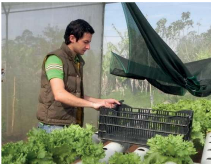
Figura 10. Caja plástica para recolectar lechugas listas para cosechar