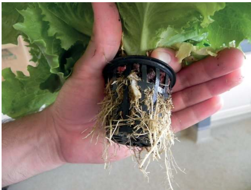
Figura 3. Canastilla ranurada plástica, con piedra volcánica

Esta piedra se consigue en viveros cuando son cantidades pequeñas, o en tajos si se requiere mayor volumen.