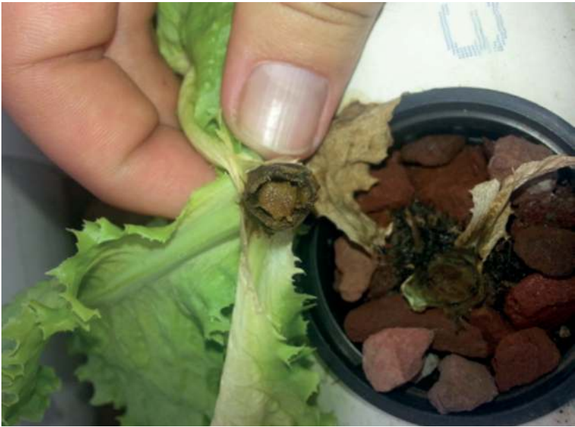
Figura 6. Lechuga afectada por hongos.