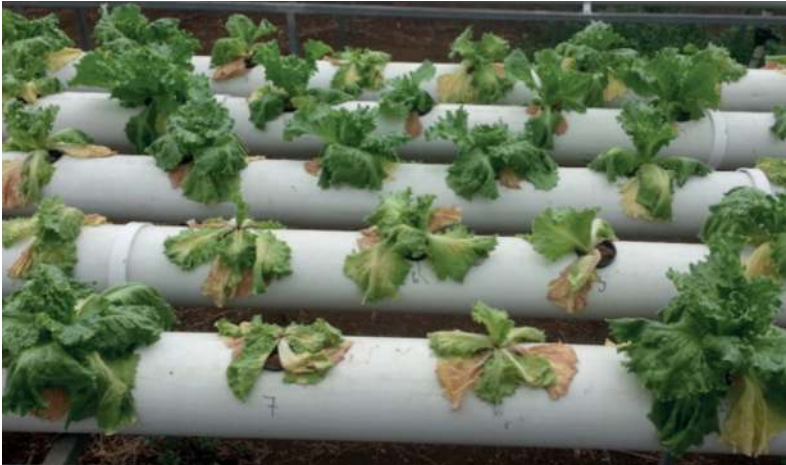
Figura 8. Lechuga con signos de marchitez y raíces oscurecidas por afección a causa del hongo Fusarium sp.