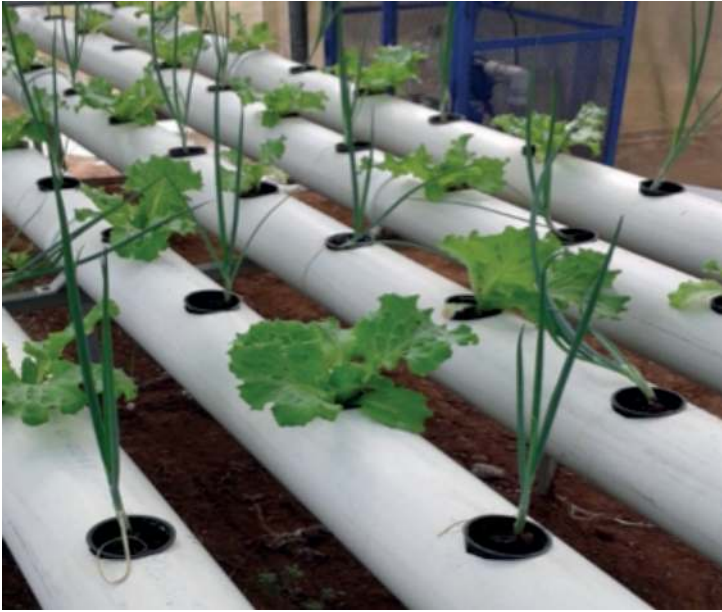
Figura 5. Ejemplo de siembra de cebollín y lechuga Fuente: Gómez & Sáenz, 2013

muestran que se ha pasado del tiempo de cosecha. Un ejemplo puntual es el inicio del desarrollo de tallo, lo que posteriormente adelanta la inflorescencia de la lechuga. Usualmente, en el mercado nacional, no se comercializan lechugas pasado ese punto.