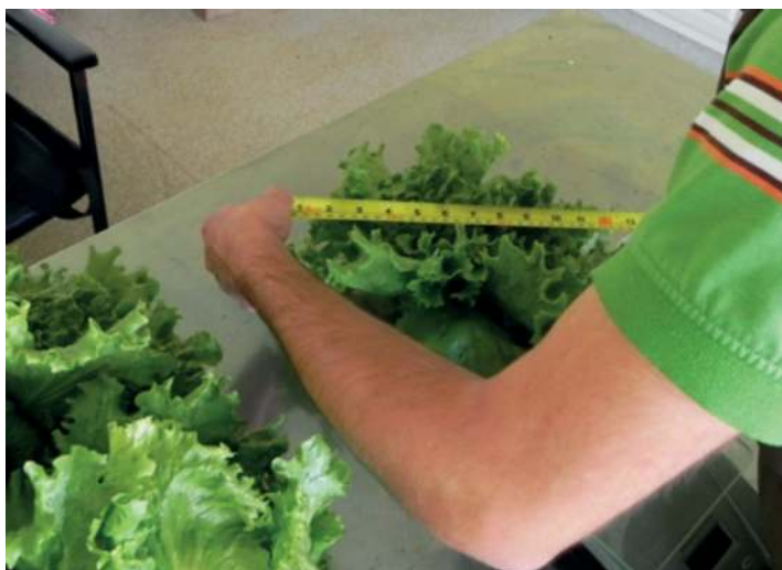
Figura 11. Medición del diámetro y pesaje de las plantas cosechadas, en un lugar fresco y limpio