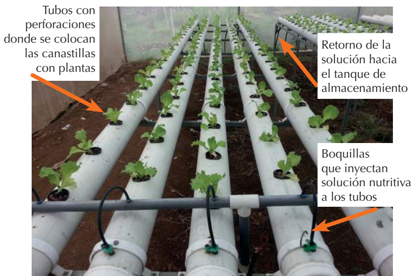
Figura 1. Cama de hidroponía NFT en invernadero del CPDIA-TEC

Es importante anotar que el tanque de almacenamiento de la solución debe mantener su contenido fresco y aislado de la luz directa, por lo que debe contar con tapa e idealmente estar bajo el nivel del suelo o en una instalación cubierta. Además, se utiliza una bomba de acero inoxidable de 3 hp, para la succión de la solución nutritiva contenida en el tanque, por lo que tiene que haber toma eléctrica. La bomba extrae la solución nutritiva y la envía a tubos de 1 pulg. para su transporte e inyección mediante las boquillas en los tubos de PVC antes descritos. Los tubos tienen un ligero desnivel (1 % como máximo), que permite que la solución fluya del punto de inyección hacia el extremo contrario y se recolecte para retornar al tanque de almacenamiento. Dicho ciclo facilita la reutilización de la solución nutritiva, para mayor aprovechamiento del recurso hídrico, y favorece la absorción en las raíces de las plantas. La siguiente figura muestra las partes antes citadas.