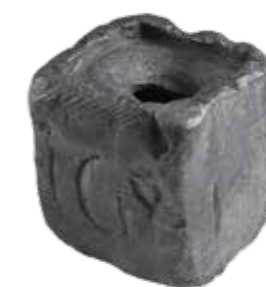
↑ Een loden inktpot met daarin ingekrast de initialen IGvI (4 cm hoog). Het is helaas niet bekend wie deze persoon is geweest. In de pot zat nog het bijbehorende sponsje.