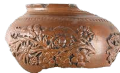
↑ Fragment van een versierde tabakspot uit Frankrijk.