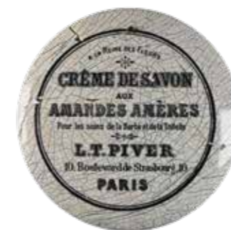
↑ Deksel van een pot scheercreme uit Parijs.