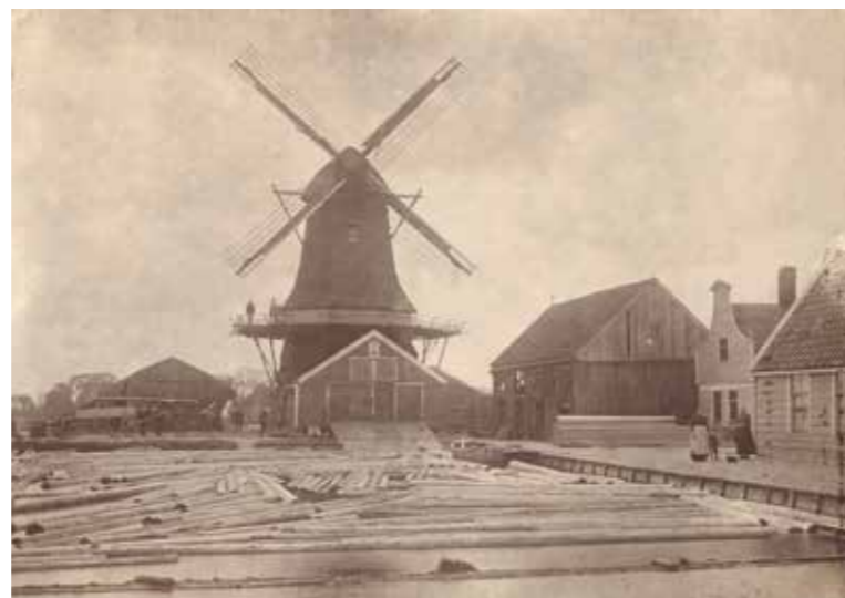
↑ De houtzaagmolen vanuit het noorden, met op de voorgrond het balkengat met de drijvende boomstammen. Links en rechts van de molen droogschuren. Uiterst rechts het woonhuis van de opzichter, dat aan de Wijzend stond. Daarachter een tweede woonhuis met houten klokgevel, dat in 1849 is gebouwd.

Tegen de kopse kant van de zaagschuur bevond zich een groot open water, het balkengat, dat aansloot op de Wijzend. Vanuit de Wijzend werden boomstammen naar het balkengat gebracht en hier bleven zij vervolgens een lange tijd liggen in het water. Dit wordt 'wateren' genoemd en had