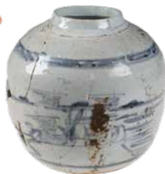
↑ Een pot van Chinees porselein uit het balkengat. De pot diende als verpakking voor gekonfijt fruit of gember.