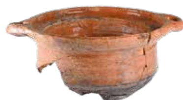
↑ Een pan van aardewerk uit het balkengat. De pan werd gebruikt om mee te koken en is in de 19 de eeuw gemaakt in Bergen op Zoom.