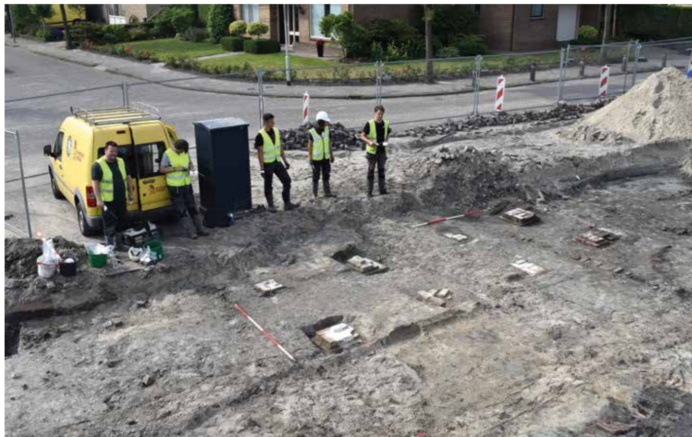
↓ De bakstenen fundamente van de zaagschuur van de houtzaagmolen. Op de achtergrond de Houtzaagmolenweg, die is vernoemd naar de verdwenen houtzaagmolen.