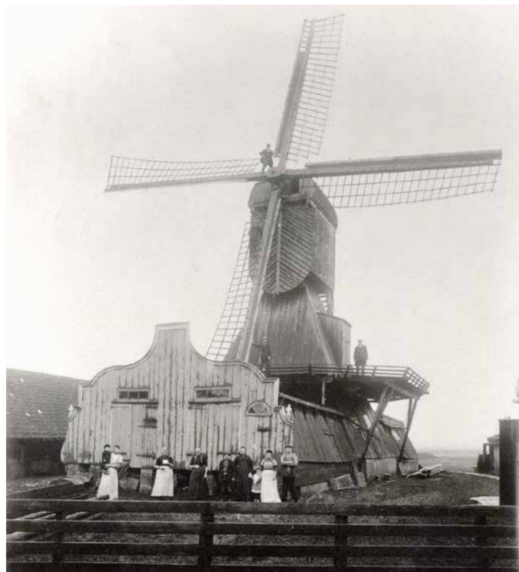
← De houtzaagmolen van Broekerhaven aan het begin van de 20 ste eeuw. Het gaat om een wipmolen op een zaagschuur. De molen is in 1916 afgebroken.

← Uitsnede uit de oudste kadastrale kaart uit 1826 met de gebouwen van de houtzagerij langs de Wijzend.