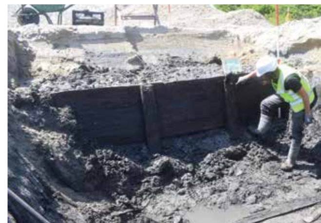
↑ De houten kadebeschoeiing van het balkengat, gemaakt van palen en planken van naaldhout.