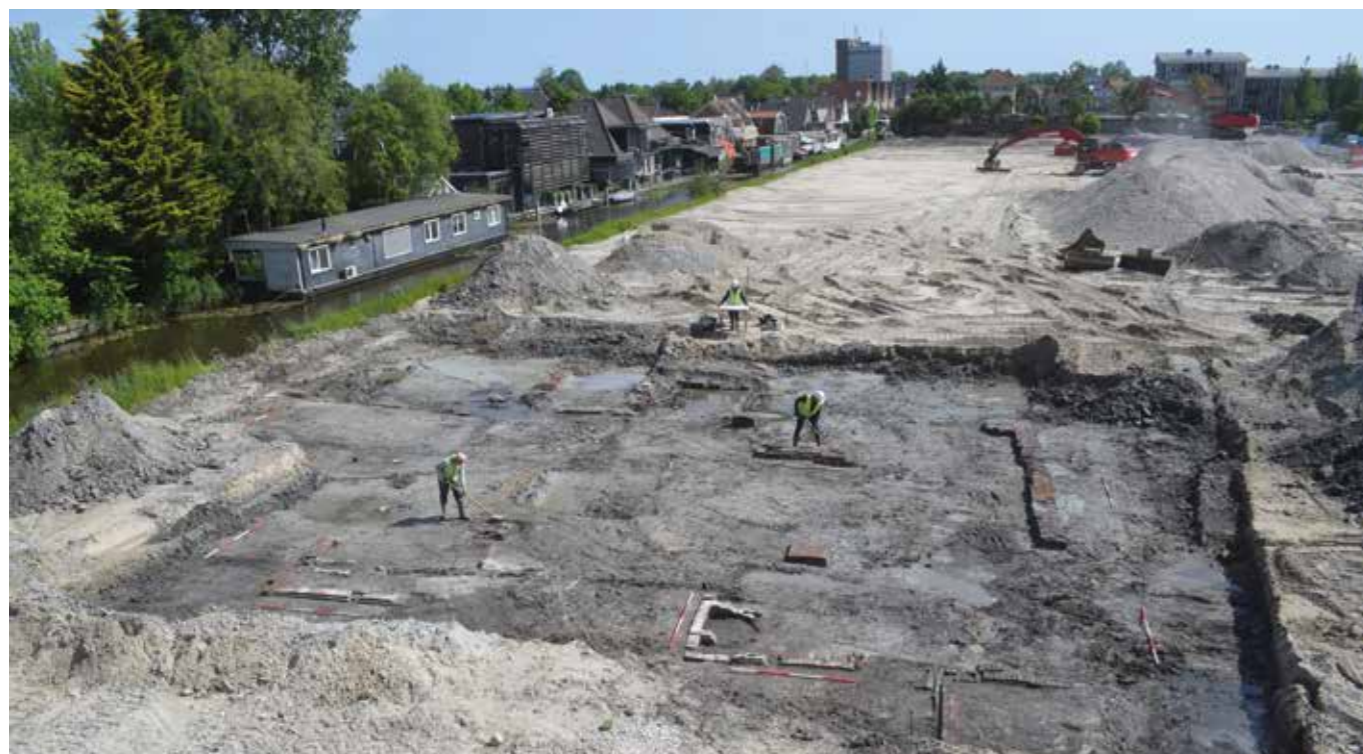
↓ Opgraving op de locatie van de stolpboerderij en het woonhuis van de opzichter. Links de Wijzend.