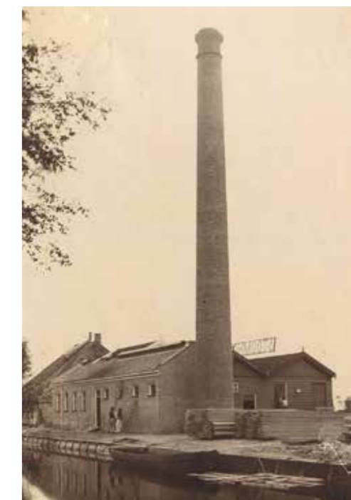
↓ De uitgebreide stoomzaagfabriek annex stoommeelfabriek met grote fabrieksschoorsteen, kort na de bouw in 1905. Op de achtergrond stolpboerderij 't Slothuys.

Het ging de nieuwe fabriek niet voor de wind. In 1909 ging het bedrijf failliet en vond een openbare verkoop plaats, waarbij de gebouwen, gereedschappen en voorraden te koop werden aangeboden. Hierna was het complex korte tijd in handen van een handelsonderneming uit Purmerend en een consortium van houtzagerijen en kooplieden. Dan gebeurt er iets opvallends: burgemeester Hector van den Steen, die de fabriek in 1909 moest verkopen, besluit in 1910 om het complex terug te kopen. Nog hetzelfde jaar liet hij de stoomfabriek en drie grote houtloodsen afbreken. De fabriek met imposante schoorsteen was op dat moment slechts vijf jaar oud! Hierna resteerde slechts het oude woonhuis aan de Wijzend, een tweede woonhuis uit 1849 dat hier vlakbij stond en het balkengat. Dit water is in 1922 gedempt en hierna herinnerde niets meer aan de eeuwenlange houtindustrie. Pas in 1953 keerde het fabriekswerk terug op deze plek: Firma Kuin & Co liet een grote timmerfabriek op het terrein bouwen. Deze fabriek werd in de loop van de 20 ste eeuw uitgebreid met nieuwe gebouwen en transformeerde uiteindelijk tot de JET BIK-fabriek. Bijna 300 jaar lang is op deze plek gezaagd, getimmerd, gemalen en gefabriceerd. Daaraan in nu een einde gekomen, maar er verrijst een nieuwe woonwijk gebouwd op de vlijt van het Spanbroeker verleden.