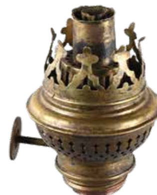
↑ Kosmosbrander van een petroleumlamp uit het balkengat.