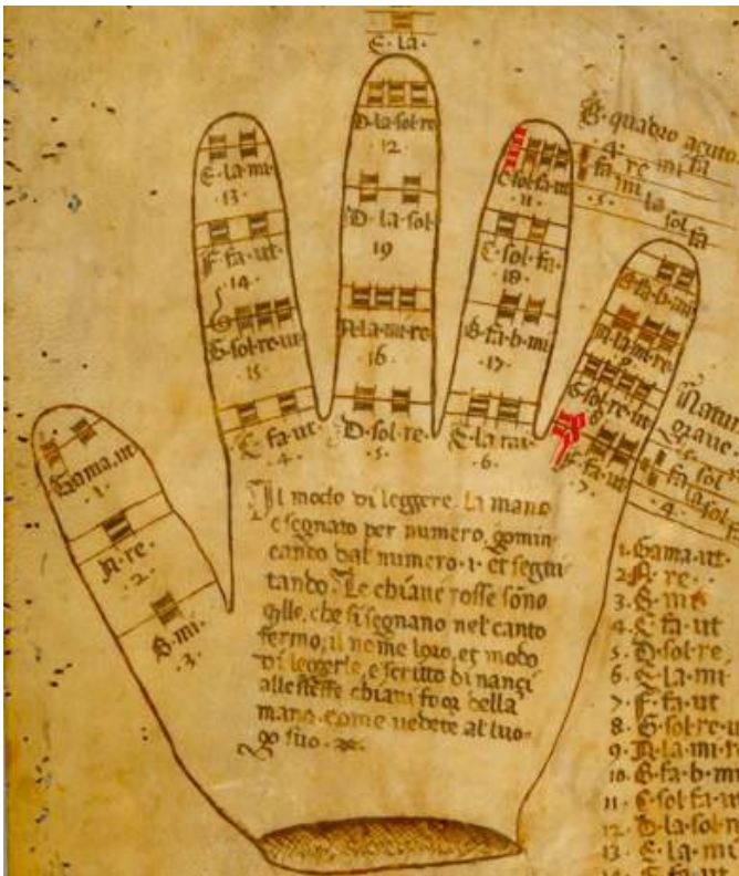
Figura 4. La mano Guidoniana. Siglo XV