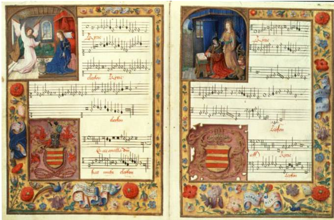
Figura 6. Codex Chigi. Siglo XVI. Kyrie de la Misa Ecce ancilla Domine de Ockeghem. Notas blancas escritas con tinta sobre papel, en lugar de pergamino.