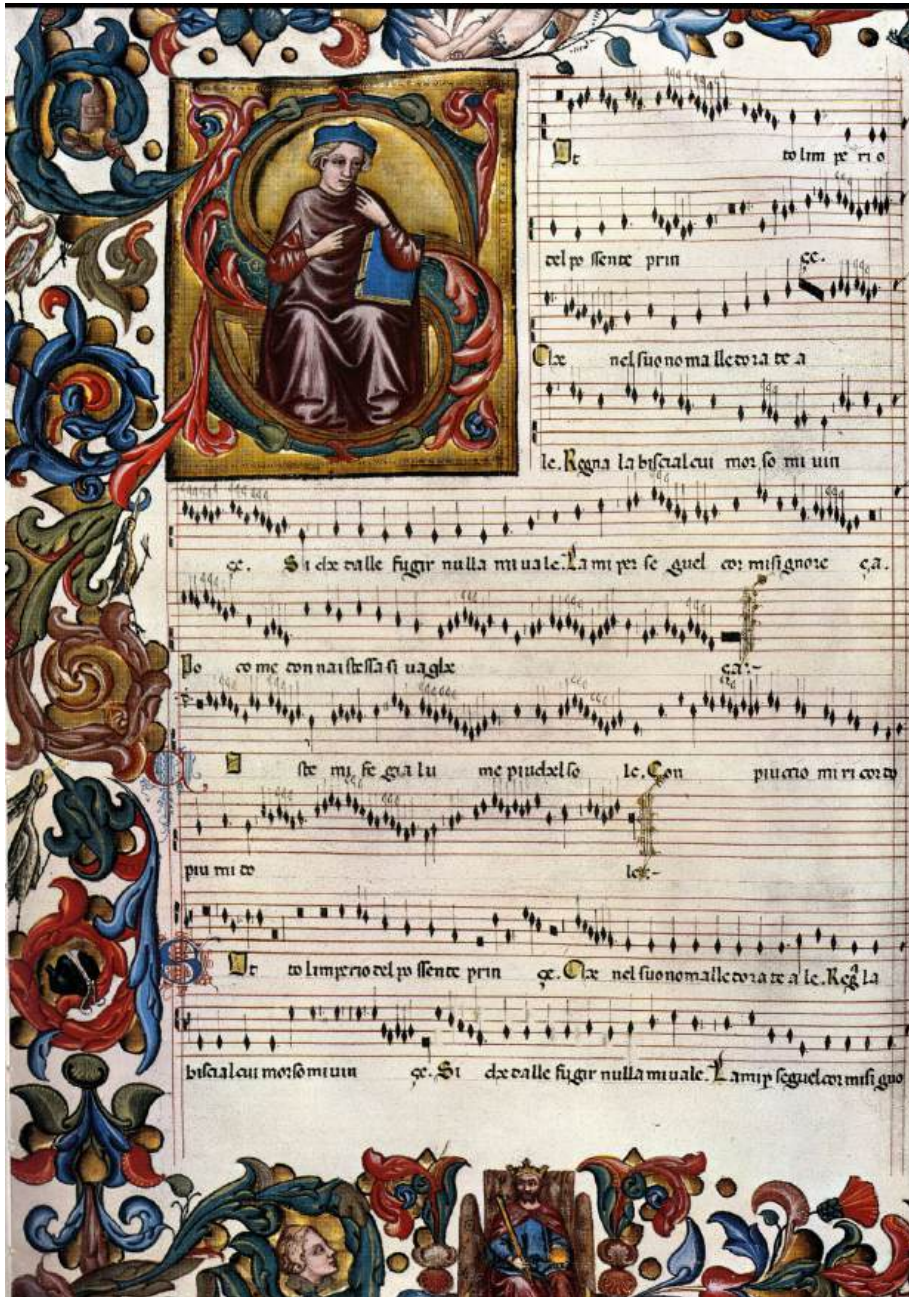
Figura 5. El Ars Nova. Códice Squarcialupi. Biblioteca Laurenziana de Florencia. Siglo XVI.