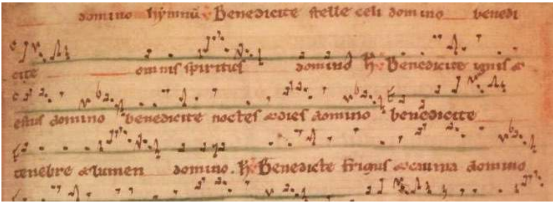
Figura 3.- La notación cuadrada. Fragmento del Misal de París. Siglo XII