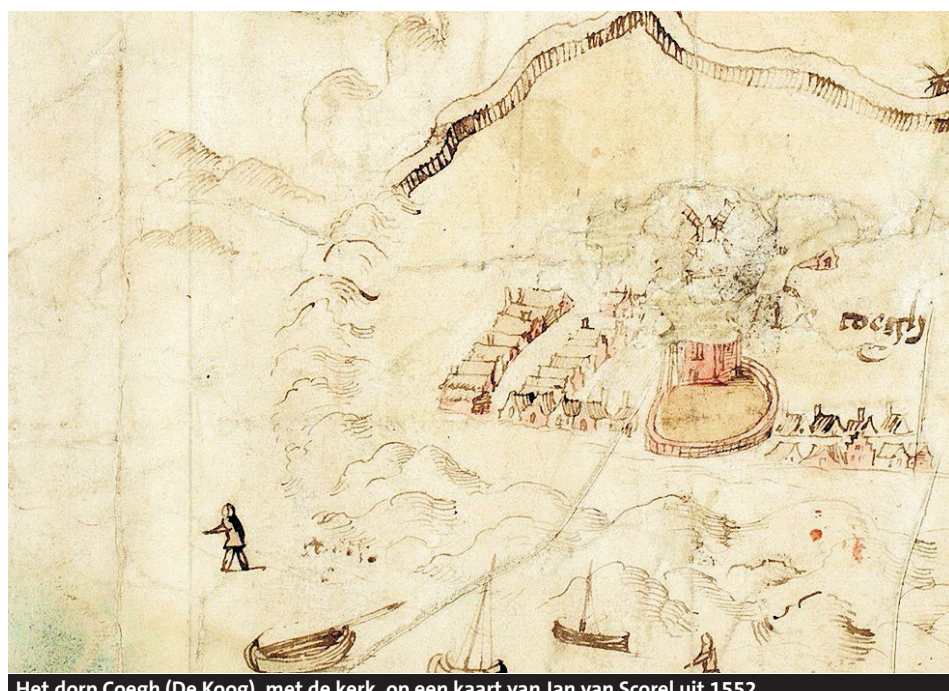
Het dorp Coegh (De Koog), met de kerk, op een kaart van Jan van Scorel uit 1552.

Archeologisch onderzoek heeft stukjes verdwenen Texelse geschiedenis weer tevoorschijn gebracht. Zoals een hypothetische reconstructie van de lang verdwenen kerk op de heuvel op De Vogelmient bij De Koog. En in Oosterend de oudst bekende tuunwal.