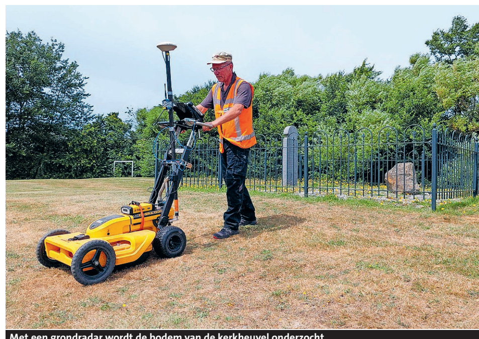
Met een grondradar wordt de bodem van de kerkheuvel onderzocht.

Vergelijkbare structuren zijn elders rond grafheuvels gevonden. Mogelijk is de grond die vrijkwam bij het graven van de kuilen gebruikt om binnen de krans een kleine heuvel op te werpen, afgedekt met graszoden. Dat zou verklaren