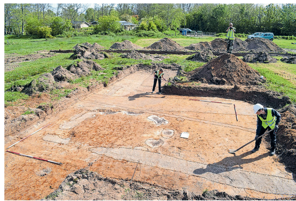
Deze kuilenkrans in Oosterend is van Midden-Bronstijd (1800-1100 v.Chr.)