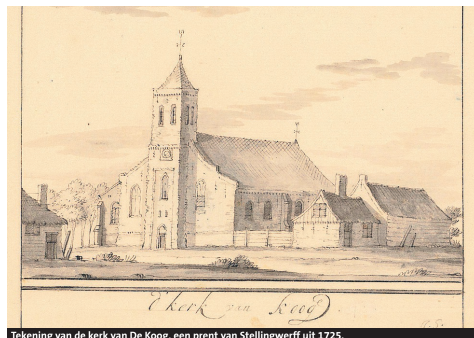
Tekening van de kerk van De Koog, een prent van Stellingwerff uit 1725.

heuvel. AWF adviseert wel om in de toekomst nogmaals archeologisch onderzoek te doen, waarbij wel wordt gegraven. Dit om de beschreven hypothese over de bouw en ontwikkeling van de bakstenen kerk, het kerkhof en de kerkhofmuur aan een nader onderzoek te onderwerpen.