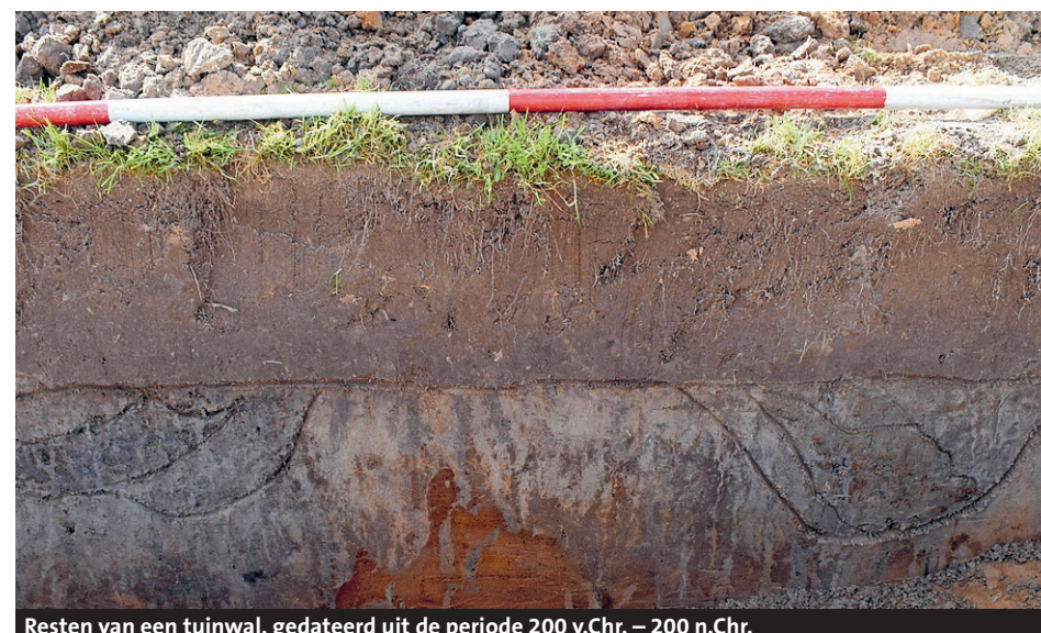
Resten van een tuunwal, gedateerd uit de periode 200 v.Chr. – 200 n.Chr.

waarom een latere greppel precies om de krans heen loopt. Wellicht dateert deze greppel uit de Midden of Late IJzertijd (500-12 v.Chr.) Naast deze structuur zijn meerdere parallelen greppels met zoden gevonden, die mogelijk resten van een prehistorische tuunwal vormen. Het enige fragment aardewerk uit een van de greppels dateert uit de periode 200 v.Chr. – 200 n.Chr. Het zou daarmee de oudste