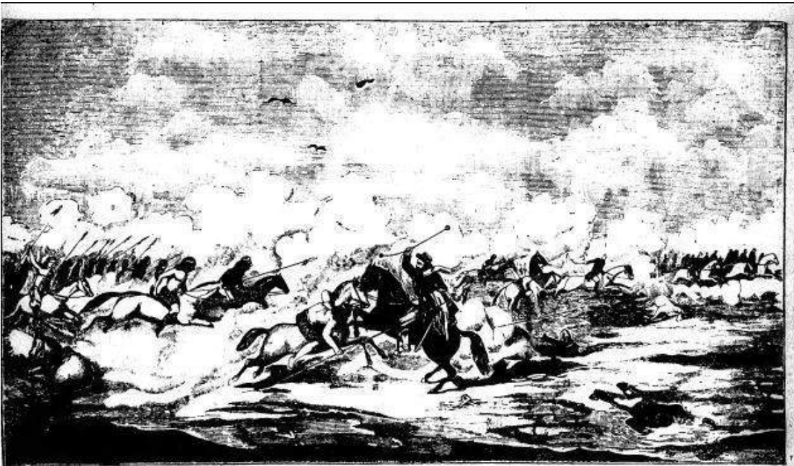
Era el hijo de un cacique — según yo lo averigué — la verdad del caso jué — que me tuve apuralazo — hasta que al fin de un balazo — del caballo lo dejó.

http://upload.wikimedia.org/wikipedia/commons/4/44/El_Gaicho_Mart%C3%ADn_Fierro_3.jpg