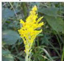
Arnica-do-campo Solidago chilensis