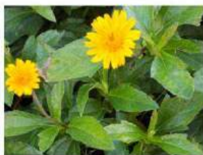
Arnica-da-praia Sphagneticola trilobata