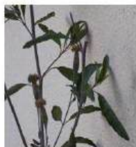
Arnica-paulista Porophyllum ruderale

Existem mais duas plantas chamadas arnicas a Arnica-do-cerrado, ( Lychnophora ericoides ) e a arnica verdadeira, planta européia ( Arnica Montana )