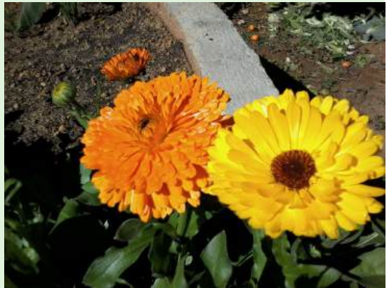
Planta: Calendula officinalis

Historicamente o uso de plantas medicinais remonta a eras pré-históricas e a convivência do homem com estas é antropológica. Após ingerir determinada planta experimentou melhora ou piora de algum padecimento que o acometia. Observou, também, esses efeitos entre os animais do habitat que compartilhavam. Com o