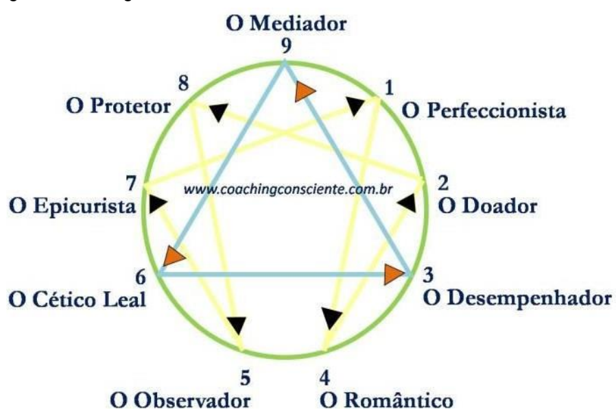
Figura 1 – Eneagrama

A palavra deriva do grego (ennea = nove, grammos = figura) e faz alusão aos nove pontos identificados ao longo da circunferência externa do eneagrama (PALMER, 2009). Onde representa graficamente por meio de uma imagem geométrica (figura 1) os nove tipos principais de personalidades, ele é resultado da evolução da psicologia moderna (RISO; HUDSON; 2009), existente há muitos anos, não se sabe exatamente de onde veio, mas desde as primeiras civilizações cristãs, na idade média e no oriente, encontram-se vestígios e traços do estudo deste desenho.