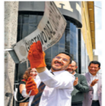
El jefe de Gobierno encabezó el acto en V. Carranza.