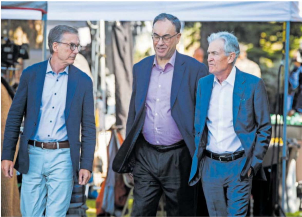
Los gobernadores Tiff Macklem, del Banco de Canadá, y Andrew Bailey, del de Inglaterra, con Jerome Powell, en Jackson Hole.