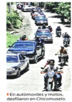
En automóviles y motos, desfilaron en Chicomuselo.