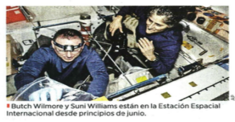
Butch Wilmore y Suni Williams están en la Estación Espacial Internacional desde principios de junio.

Starliner han generado retrasos que le han costado a la empresa unos mil 600 millones de dólares. Este fracaso se suma al del 737 Max, el avión comercial de Boeing que ha sufrido varias crisis, incluida una este año en la que un panel de una puerta de uno de los aviones se desprendió en pleno vuelo.