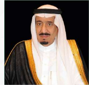
حكومة الحرمين الشريفين الملك عبدالعزيز بن عبدالعزيز آل سعود

قيادة حكيمة.. رؤية ثاقبة.. وعمل دؤوب لرفعة هذا الوطن بعقول أبنائه..