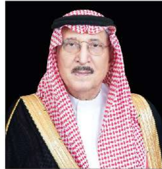
صاحب السمو الملكي الأمير / محمد بن ناصر بن عبدالعزيز آل سعود أمير منطقة جازان