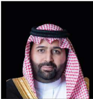
صاحب السمو الملكي الأمير / محمد بن عبدالعزيز بن محمد بن عبدالعزيز آل سعود نائب أمير منطقة جازان