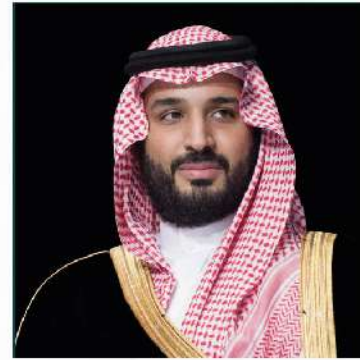
صاحب السمو الملكي الأمير محمد بن سلمان بن عبدالعزيز آل سعود ولي العهد نائب رئيس مجلس الوزراء