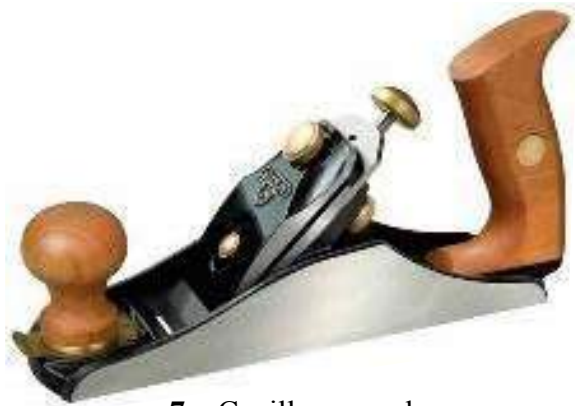
7 – Cepillo manual

Antes de usar el cepillo debemos comprobar la disposición de la hoja y regularla más o menos de acuerdo a la viruta que se quiera obtener. Hay cepillos para rebajar y producen viruta gruesa y otros para pulir y producen viruta mucho más sutil.