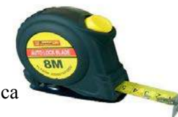
2b – Cinta métrica