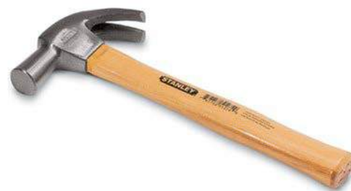
1 – Martillos

El manejo de un martillo no está exento de peligro, y hay que tomar ciertas precauciones al golpear materiales que ofrecen mucha resistencia. Precisamente en estos casos es decisivo que la cabeza esté sólidamente retenida por el mango.