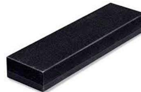
6b - Piedra de asentar

Las piedras de amolar (que se fabrican con diversas granulaciones) pueden ser utilizadas en seco: es el caso de las que se emplean para reparar el filo de los cuchillos. Otras hacen posible un afilado más fino con ayuda del agua. Finalmente hay otras que requieren el empleo de aceite que facilite el afilado de herramientas de corte como los formones, las hojas de los cepillos etc.