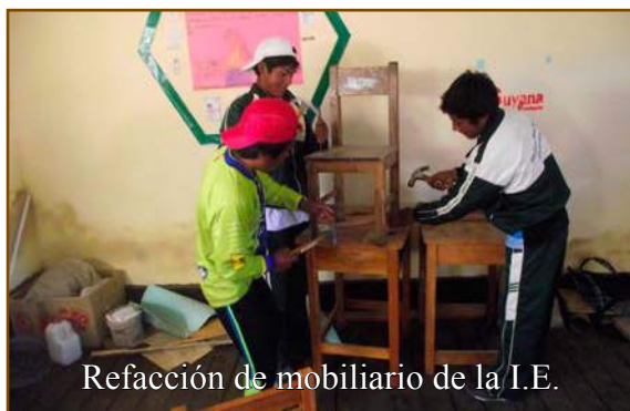
Refacción de mobiliario de la I.E.