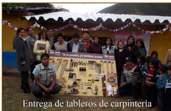
Entrega de tableros de carpintería