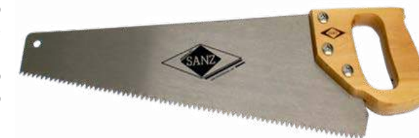
5a - Serrucho grande

El serrucho es comúnmente usado para cortar en sentido transversal a la fibra de la madera y ocasionalmente en sentido de la fibra. Para uso genérico, está bien el serrucho de siete dientes por pulgada.