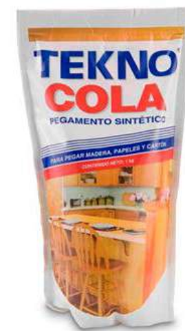
10 – Cola de carpintero