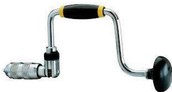
8e – Taladro de Pecho

El poder de penetración depende del tipo de broca que se monte.