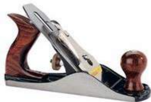
7 – Cepillo manual

Para comenzar el cepillado la cabeza del cepillo debe descansar sobre el principio de la tabla, teniendo una mano sobre la parte delantera del cepillo y la otra imprime el movimiento de avance. La presión que inicialmente se ejercía en la parte delantera del cepillo quedará absorbida progresivamente por la otra mano de modo que a la mitad del recorrido las cargas quedaran equilibradas sobre ambas manos. Al llegar al final, en cambio la presión mayor es ejercida por la mano que empuja la herramienta.