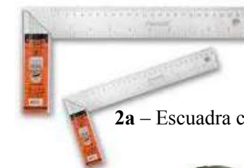
2a – Escuadra combinada