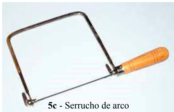
5c - Serrucho de arco

El arco de cortar venesta dotado por Suyana cuenta con 5 sierras de diferentes medidas.