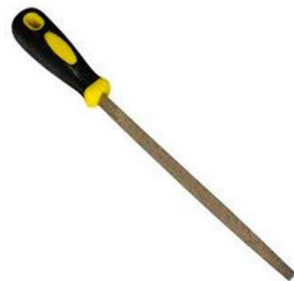
6a - Limas

Una lima está constituida por una hoja de acero muy duro dotado de estrías en forma de dientes y dispuestas oblicuamente. En función de la rugosidad o granulosidad de estas estrías, la lima arranca más o menos material al deslizarse, presionando, sobre una superficie de lo que se lima. En algunos casos las limas pueden desplazar al cepillo. Por lo que respecta a su granulosidad se distinguen las limas bastas, las medianas y las finas. Las intermedias suelen denominarse también bastardas. En el mercado existen limas de diferentes formas: plana rectangular, plana estrecha, media caña, redonda o cola de rata. Suyana provee la lima tipo triangular.