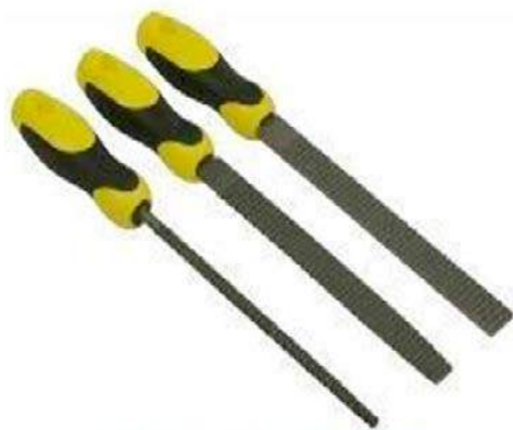
4b – Escofinas

El formón tiene la boca ancha y un grosor de hoja mucho menos que el escoplo; siendo ambas herramientas igualmente planas. El formón es la principal herramienta utilizada para vaciar la madera y rectificar las paredes de un labrado después de haber realizado los trabajos bastos de rebajado o perforado. En los trabajos de bastante profundización, así como en los lados estrechos resulta más eficaz el escoplo, pero esta herramienta es posiblemente una de las que puede prescindir el aficionado que no tenga que realizar muchos trabajos de uniones de madera basándose en cajas y espigas. En cambio siempre será conveniente tener un par de formones de distinta anchura de boca uno de media pulgada y otro de 1 pulgada.