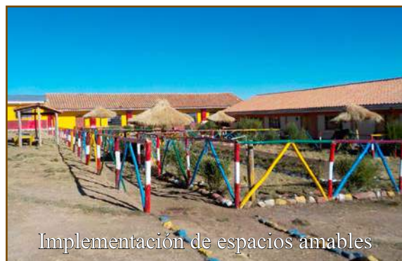
Implementación de espacios amables