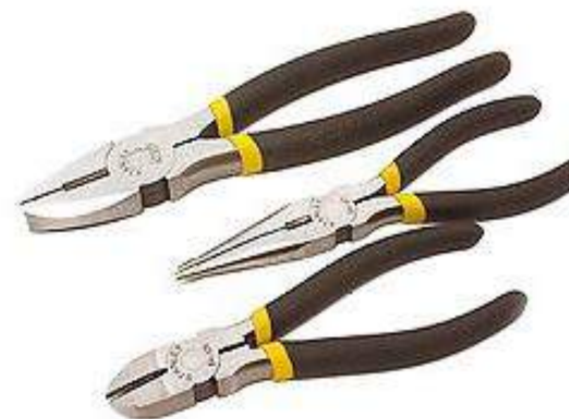
8a - Alicates

Estas herramientas incluidas en el “Tablero de herramientas de carpintería de Fundación Suyana” son requeridas para diferentes actividades en la realización de prácticas de carpintería como así también en trabajos de electricidad, ensamblado, armado y otras varias. La dotación incluye una variedad de desarmadores planos y en estrella. A su vez de alicates de variedad corte, punta y fuerza.