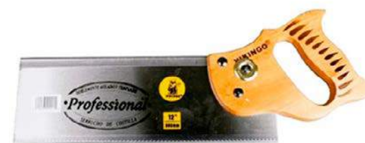
5b - Serrucho recto

Este serrucho es de hoja rectangular provista en el dorso de un doble reborde de acero que la mantiene recta, permitiendo así realizar cortes rectos con toda seguridad, suele ser de dientes pequeños. Usándolo con la Caja de ingletes se pueden realizar cortes precisos, rectos y a 45°. La caja de ingletes se consigue en el mercado en madera y plástico. No es aconsejable usar la caja de ingletes cuando debido al uso se muestran desgastes en las ranuras que sirven de guía al serrucho, porque los errores que se originan en el corte son difícilmente reparables.