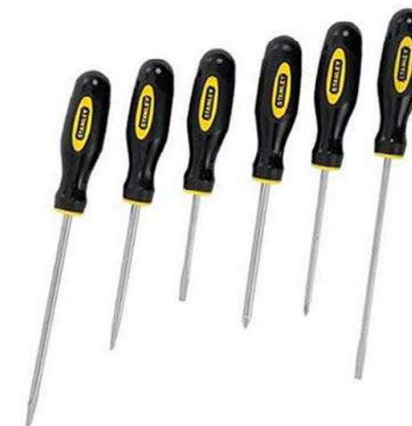
8b - Desarmadores