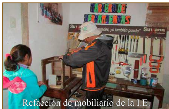
Refacción de mobiliario de la I.E.