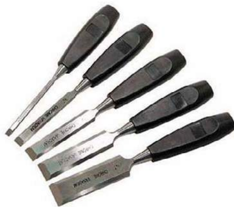
4a – Formones

Al trabajar con una herramienta de filo no debe mantenerse una mano en el sentido del trabajo de la herramienta, pues es fácil que se escape y dé lugar a un accidente importante. Las piezas deben sujetarse con prensas. Jamás con las manos situadas delante de la herramienta.