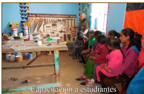
Capacitación a estudiantes