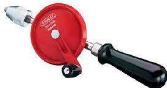
8d - Berbiquí