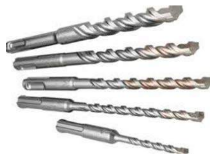
8f - Brocas