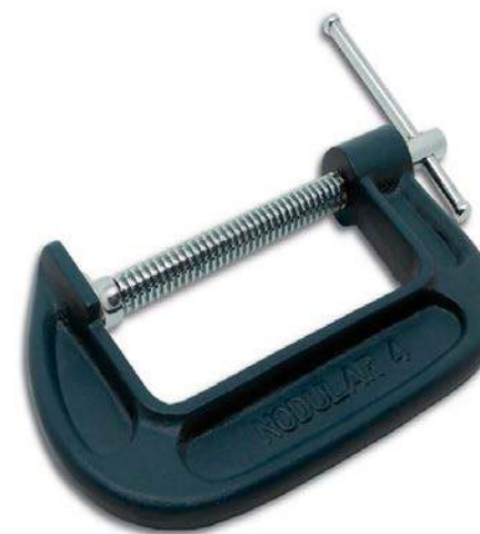
3 - Prensa tipo “C”