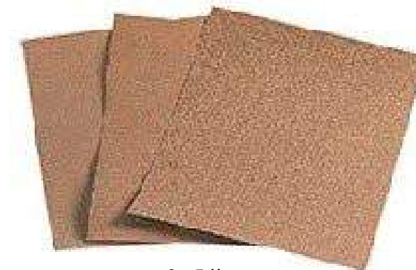
9 - Lijas

Este Lijar de madera es necesario siempre que se desee pintarla o incluso, en ciertas ocasiones, para dar un buen acabado. Si bien no constituye una tarea compleja, conviene conocer algunos consejos antes de afrontar este trabajo, para evitar posibles inconvenientes.