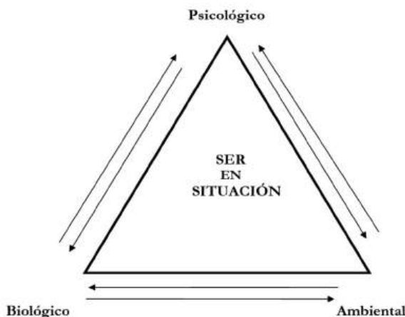
Ilustración 1. Concepción del ser como una unidad bio-psico-ambiental.

Carrasco (citado por Amorín, 2012) define al sujeto como una compleja entidad bio-psico-ambiental en la que confluyen lo biológico, lo psicológico y lo ambiental (Ilustración 1).