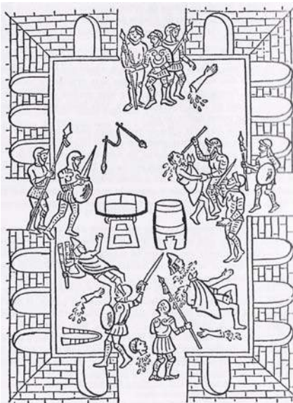
A matança da festa de Tóxcatl*

Motecuhzoma tornou-se prisioneiro de Cortez, dava-lhe tudo que pedia, especialmente ouro.