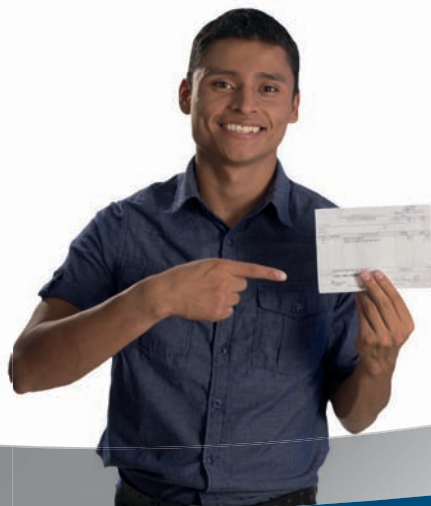
ERICK BARRONDO Medalla Olímpica en Marcha NIT: 692652-1