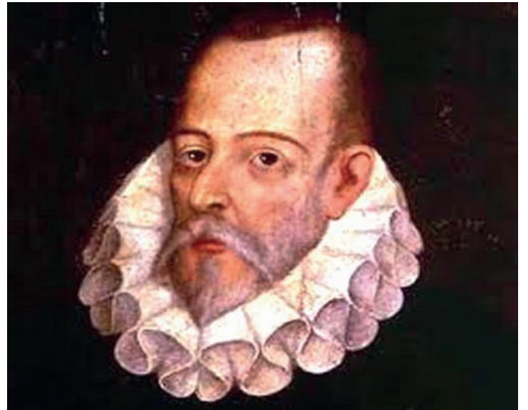
Miguel de Cervantes Saavedra trabajó en Sevilla como recaudador de impuestos (tercias y alcabalas), antes de escribir Don Quijote de la Mancha .

No obstante, este criterio se ha relativizado a medida que las propias Administraciones Tributarias han venido revisando los verdaderos alcances de sus poderes fiscalizadores y persecutorios, así como evaluando los elevados costos que suponen sus esfuerzos de fiscalización y de persecución administrativa y penal. Según un estudio del BID, las probabilidades de ser castigado por evasión tributaria en América Latina “son prácticamente nulas”.