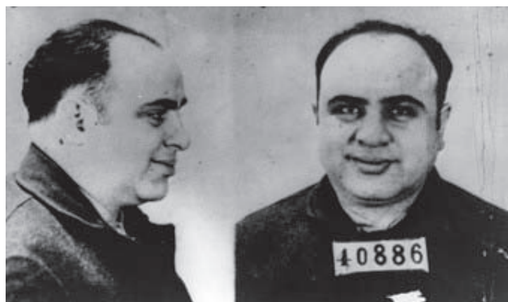
La evasión de impuestos fue el único de los delitos por el que el gobierno de los Estados Unidos logró encarcelar al famoso gánster Al Capone, cuya carrera criminal asoló la ciudad de Chicago en las décadas de 1920 y 1930.

Tradicionalmente, la educación es un proceso que pasa de una generación a otra, lo cual supone que va dirigida, en esencia, a los niños y jóvenes que serán los ciudadanos y contribuyentes del futuro. Además, el hecho de que la educación contemple la formación en valores subraya el papel de los menores de edad como destinatarios centrales de la acción educativa.