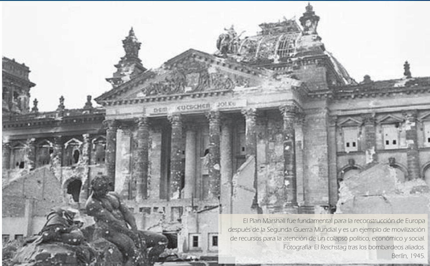
El Plan Marshall fue fundamental para la reconstrucción de Europa después de la Segunda Guerra Mundial y es un ejemplo de movilización de recursos para la atención de un colapso político, económico y social. Fotografía: El Reichstag tras los bombardeos aliados. Berlín, 1945.