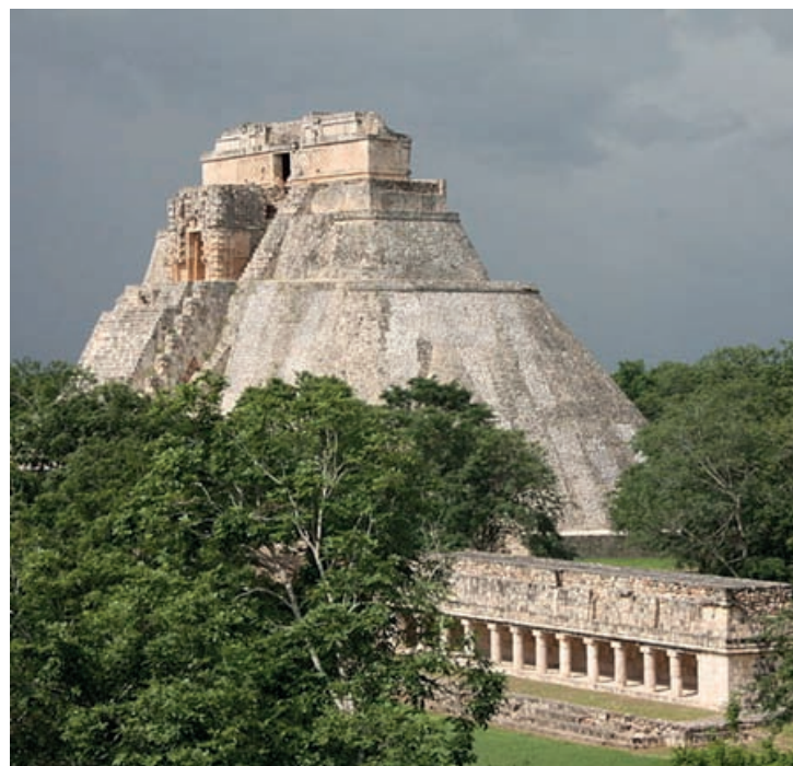
El trabajo gratuito era el principal tributo existente en la civilización maya y fue la base para la construcción de sus imponentes edificaciones.

No. La SAT es responsable de administrar la recaudación de los impuestos, pero no de su utilización. Ésta le compete a otros órganos del Estado: en primer lugar, al Congreso de la República, entre cuyas atribuciones se encuentra la de aprobar, modificar o improbar el Presupuesto de Ingresos y Egresos del Estado, cuyo proyecto corresponde elaborar y presentar al Organismo Ejecutivo; 18 y en segundo lugar, al Ministerio de Finanzas Públicas, el cual es el órgano rector del proceso presupuestario y como tal le corresponde el control de los presupuestos del sector público. 19