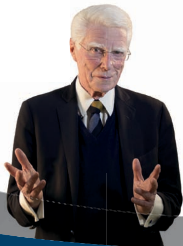
DR. ALDO CASTAÑEDA Cirujano Cardiovascular Pediátrico Fundación Aldo Castañeda NIT: 1667739-0