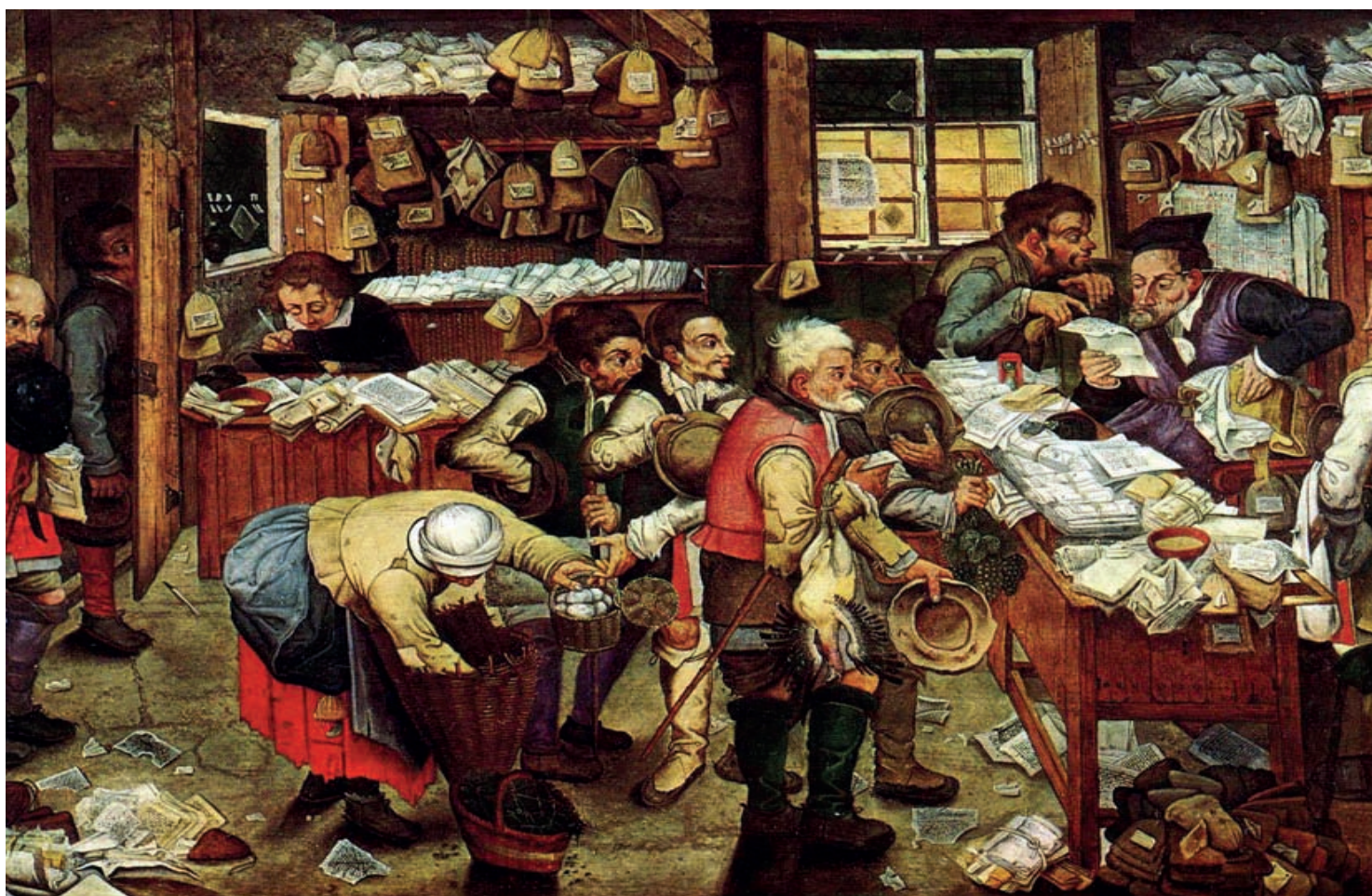
“El recaudador de impuestos”, obra de Pieter Bruegel el Joven (1621), muestra a un grupo de aldeanos flamencos entregando sus impuestos en especie (huevos, aves de corral, animales de caza y otros) en una oficina de recaudación colmada de papelería y otros aportes recibidos. Fisher Museum of Art, Los Ángeles.

Así puede resumirse el fin último del quehacer de cultura tributaria: que el impuesto como obligación legal se transforme en un autoimpuesto asumido por el ciudadano como un compromiso social.