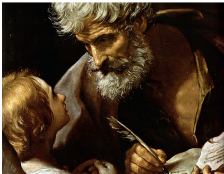
Mateo, también llamado Leví, ejercía el oficio de recaudador de impuestos antes de ser discípulo de Jesús y convertirse en uno de los cuatro Evangelistas. Ilustración: San Mateo y el ángel, por Guido Reni (1640). Galería Vaticana.