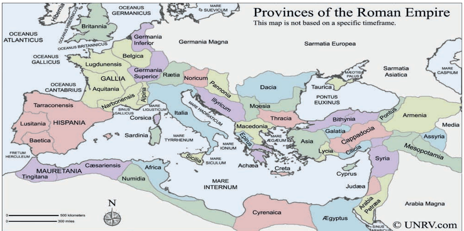
La hacienda pública de la Antigua Roma se enriqueció tan grandemente con sus conquistas, que le permitió eximir de impuestos a sus ciudadanos en Italia y volcar todo el peso de la recaudación a sus numerosas provincias.

No obstante, su Ley Orgánica faculta a la SAT para “asesorar al Estado en materia de política fiscal y legislación tributaria, y proponer por conducto del Organismo Ejecutivo las medidas legales necesarias para el cumplimiento de sus fines”. 14