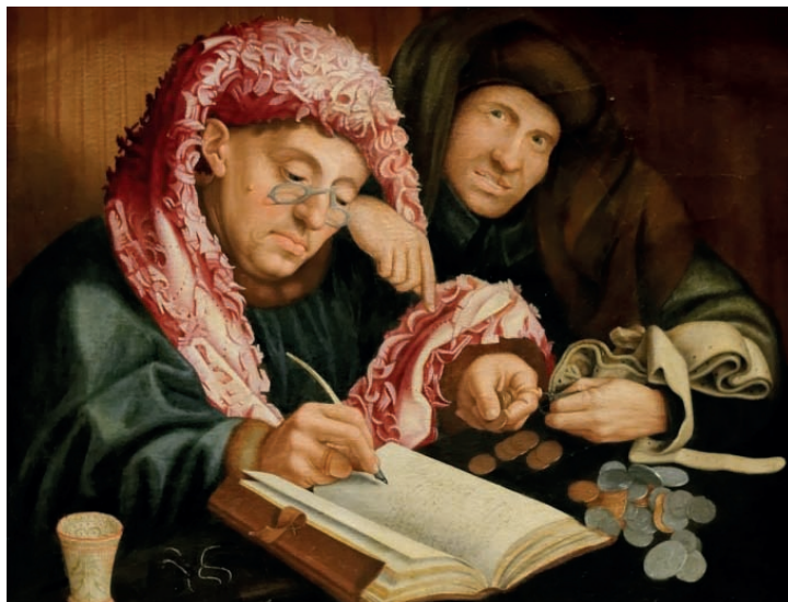
En Alemania, alrededor del año 1500, los impuestos en efectivo eran pagados a los Kammerer (tesoreros). Actualmente, los encargados de las administraciones financieras municipales alemanas siguen llevando ese título. Ilustración: “El recaudador de impuestos”, obra de Jan Matsijs. Kunsthistorisches Museum, Viena.