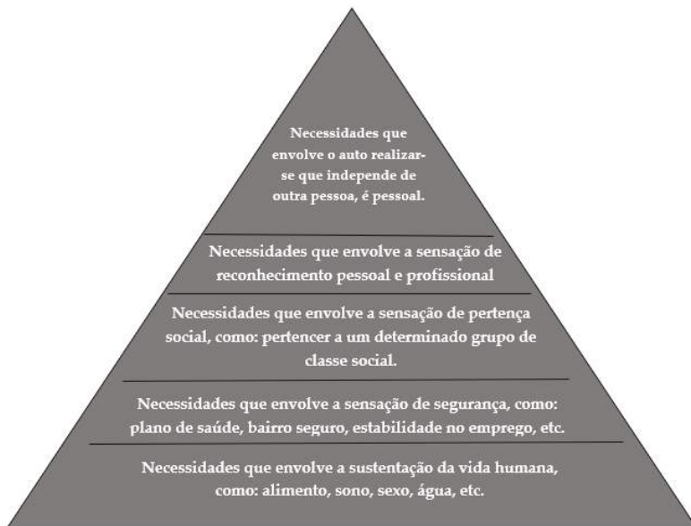
Figura 1 – Hierarquia das necessidades segundo Maslow

Com sua teoria de motivação, Maslow (1943) diz que os seres humanos são motivados por necessidades, onde cada uma busca satisfazer a outra, subindo cada vez na pirâmide até alcançar o alto grau de satisfação, como pode ser visto na Figura 1.