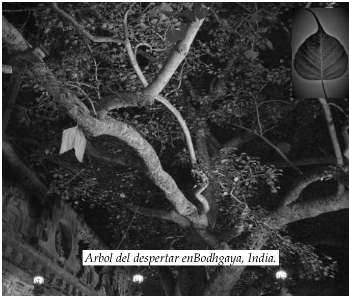
Arbol del despertar en Bodhi Gaya, India.

Sentado bajo las ramas de lo que hoy se conoce como el árbol del despertar, desarrolló su mente en estados de meditación tranquila y luminosa.