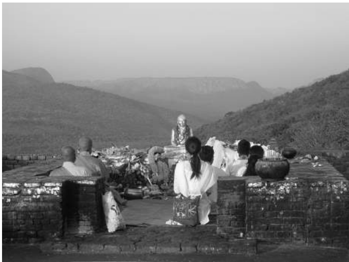
(Magadha, India: Antigua residencia del Buda en la colina de los buitres.)

La escuela Mahayana tomo raíces en China y desde allí se extendió a Japón, Corea y Vietnam.