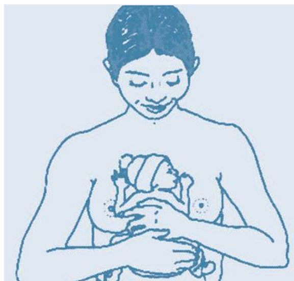
Figura 1. Posición para el contacto piel con piel o cuidado canguero.

A veces puede ayudar contactar con los grupos de apoyo para la lactancia que existen en casi todas las ciudades españolas.