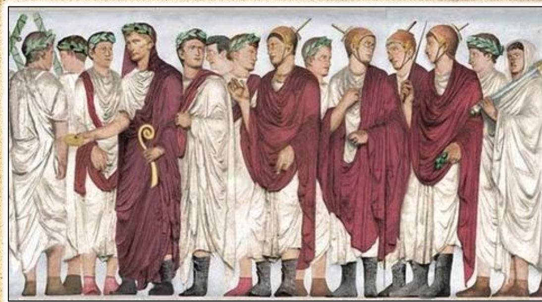
Свештеници прислужници на олимските богови