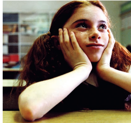
CUATRO La escuela

Si tiene los recursos, puede decidir iniciar el proceso por su cuenta. Si decide hacer esto, puede hablar con el pediatra o terapeuta de su hijo, quien puede tener algunas sugerencias para usted. También puede comunicarse con la Asociación Nacional de Escuelas y Programas Terapéuticos ( www.natsap.org ) para encontrar una escuela o contratar a un consultor educativo especializado en escuelas terapéuticas. La Asociación de Consultores Educativos Independientes ( www.iecaonline.com ) es un buen recurso para ayudarlo a encontrar un consultor en su área.