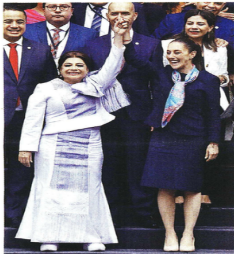
La Presidenta Claudia Sheinbaum acompañó a la nueva Jefa de Gobierno en su toma de protesta.

"Enfrentamos desafíos que no se contienen en las fronteras político administrativas que dividen a nuestra entidades o que separan a los municipios".