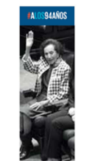
#A LOS 94 AÑOS