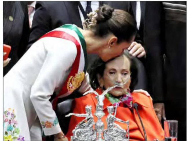
▲ Fue la primera mexicana en obtener maestría en economía en la Universidad