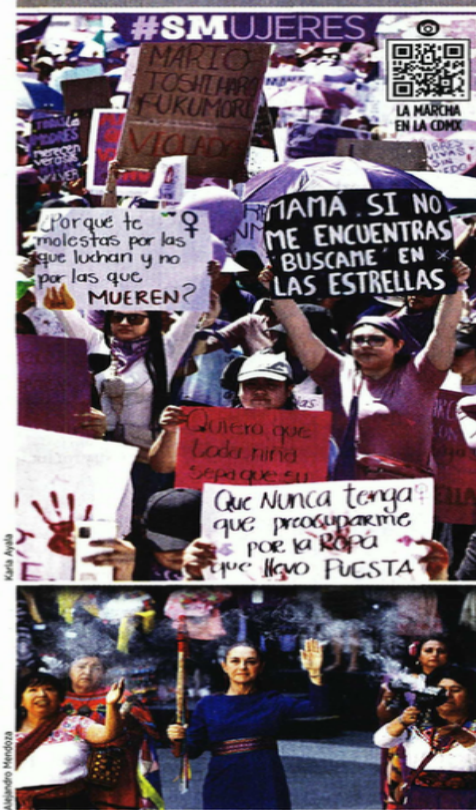
■ Mientras en las calles de la CDMX se manifestaron más de 200 mil personas, en Palacio Nacional, la Presidenta Sheinbaum se comprometió a realizar las reformas que pongan fin a la violencia contra las mujeres.