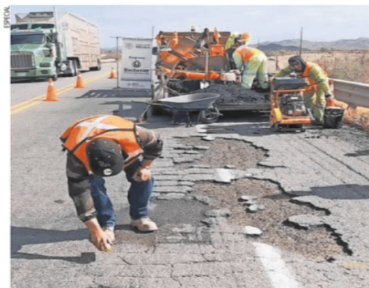
En los programas de conservación carretera participan 2 mil 373 trabajadores, apoyados con maquinaria especializada.

En ambas acciones participan 330 cuadrillas y 2 mil 373 trabajadores, apoyados con 2 mil 344 equipos de maquinaria especializada como son perfiladoras, compactadoras, extendedoras y excavadoras. ●