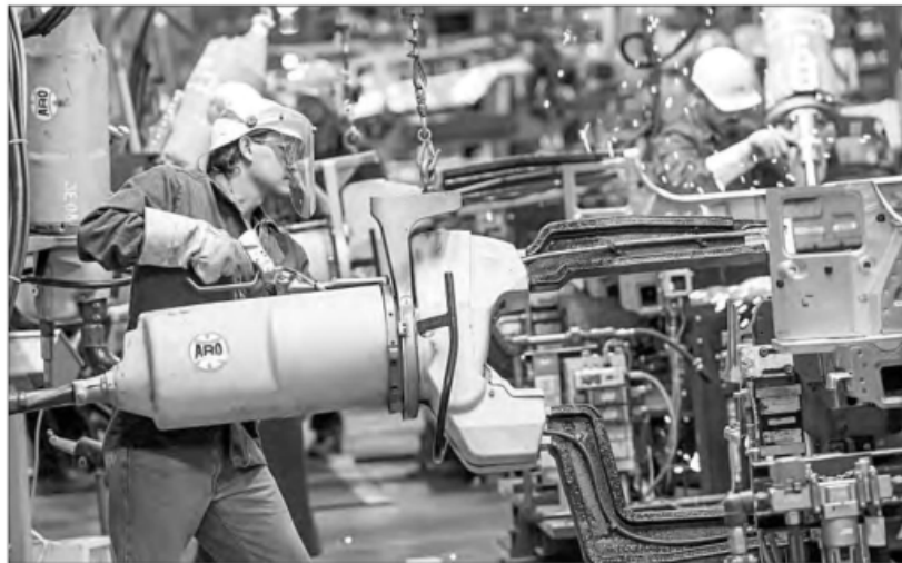
◀ El sector automotor, vulnerable ante los aranceles, destacan especialistas.

Analistas de Intercam explicaron que si un automóvil no cumple con las reglas de origen instauradas en