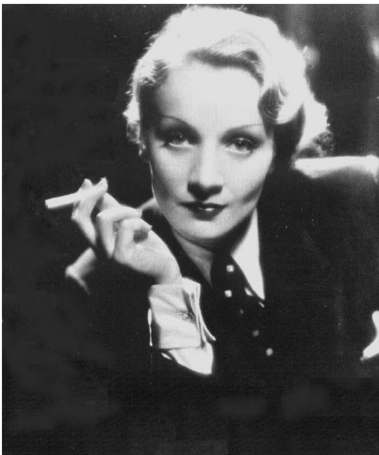
Marlene Dietrich que fez do terno seu emblema / Marlene no filme Marocco em 1932 que sacudiu o público com cenas picantes

A alfaiataria, usada pela mulher, é o grande marco da história do vestuário no séc. XX. Como roupa de mulher, o terno tailleur carrega consigo os mesmos valores de sensualidade e poder que estão neste traje como roupa masculina. E é esta a condição que mantém a alfaiataria no topo das questões históricas do vestuário. Questões estas que têm se mostrado mais importantes do que as questões da moda e sua efemeridade.