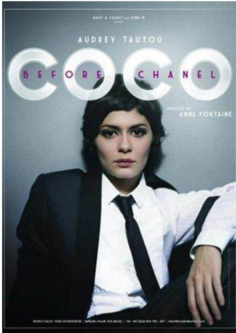
Filme sobre a vida da Chanel, primeira estilista a trazer para suas criações o universo masculino