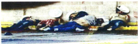
Los cuerpos fueron abandonados con un sombrero.