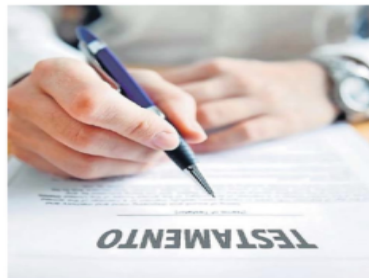
La campaña 'Septiembre, mes del testamento' no ha sido suficiente, consideran especialistas.

"Es un error, porque heredan problemas. A falta de certeza sobre cómo repartir los bienes entre los herederos, el código civil de cada estado define quienes son los he-