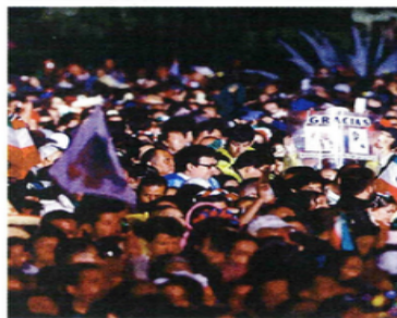
AMLO se despidió de sus simpatizantes tras encabezar el Grito, acompañado por Sheinbaum.