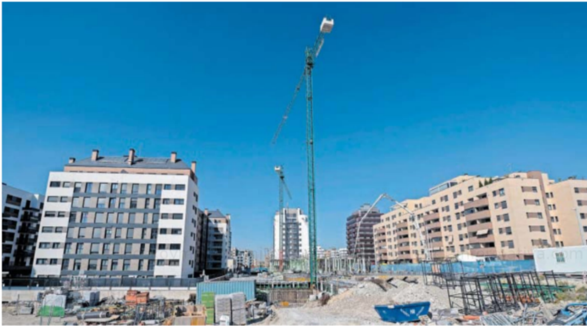
Edificios de viviendas en construcción en Madrid.