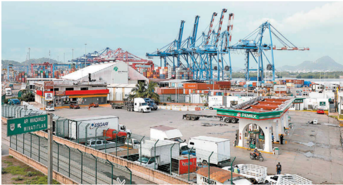
Llaman a invertir en la expansión de puertos y a desarrollar nuevos.