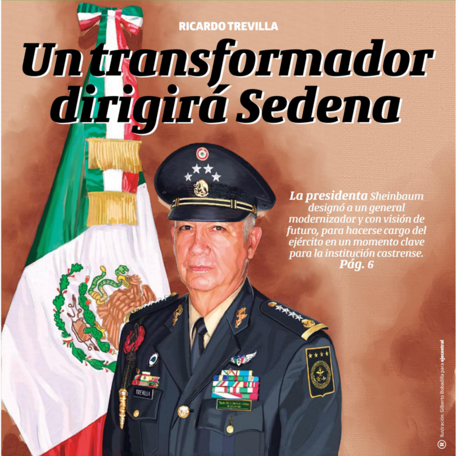
Ilustración: Gilberto Bobadilla para ejeC central

La presidenta Sheinbaum designó a un general modernizador y con visión de futuro, para hacerse cargo del ejército en un momento clave para la institución castrense. Pág. 6