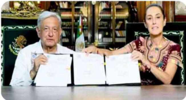
López Obrador promulga la reforma al Poder Judicial, con Sheinbaum COMO TESTIGO

AMLO FIRMA Y PUBLICA la reforma judicial, PESE A ORDEN DE JUEZ