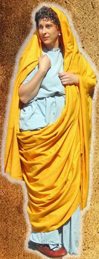
СТОЛА И ПАЛА