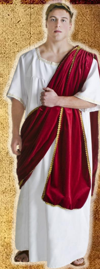
ТУНИКА И ТОГА