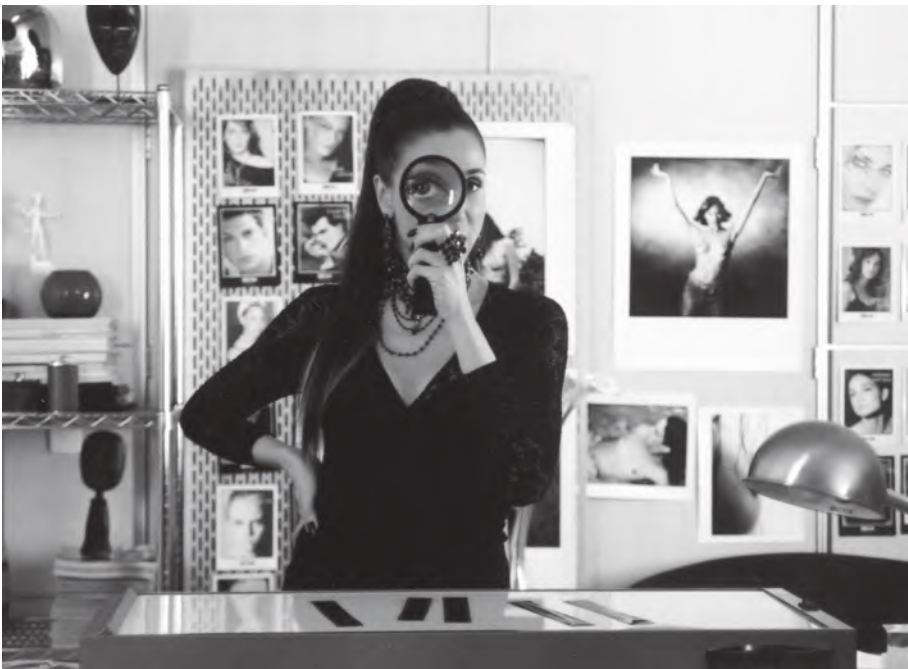
A perversa Lilith