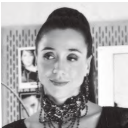
Marisa Orth, a perversa Lilith