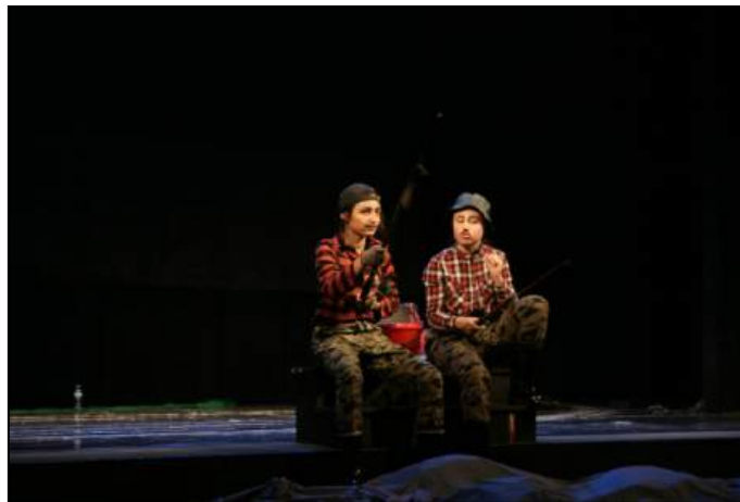
Imagen del estreno.