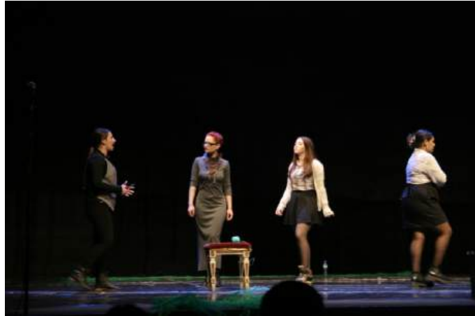
Imagen del estreno.