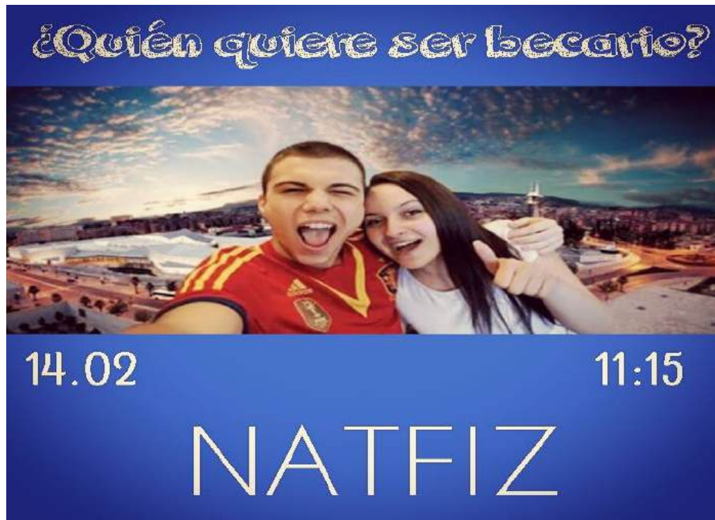
FOTO DE PORTADA O PROGRAMA

La Consejería de Educación, ha organizado el concurso 10 preguntas que darán a nuestro valiente concursante la posibilidad de pasar un año estudiando en Granada con todos los gastos pagados. ¿Sabrá Misho todas las respuestas? ¿Podrán ayudarle sus recuerdos? ¿Será todo un sueño?