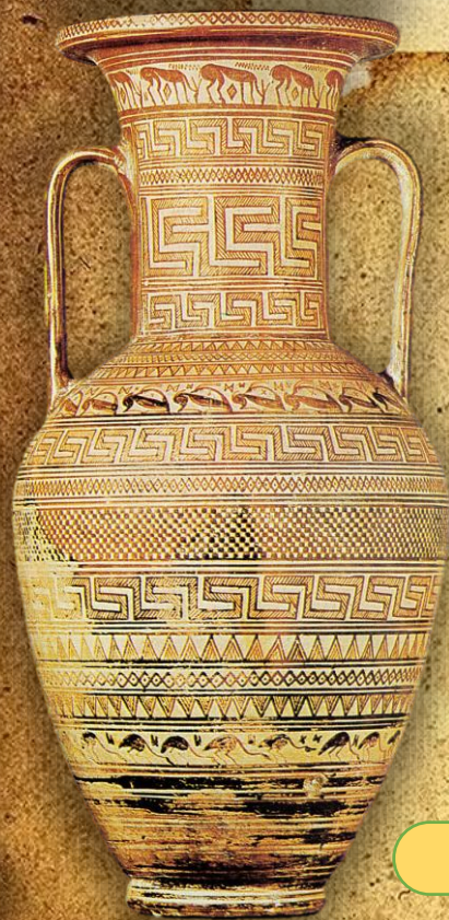
Ваза во геометриски стил