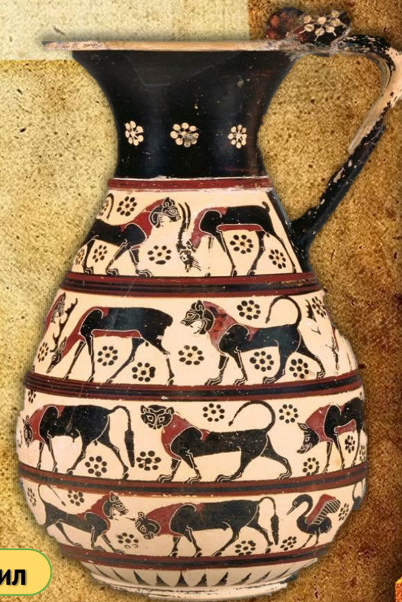
Ваза во ориентализиран стил