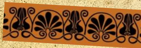
Палмети со лотосови пупки