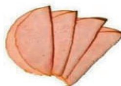
Peito de peru