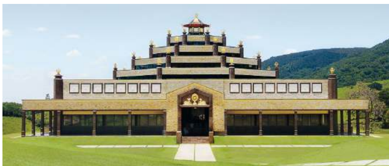
TEMPLO KADAMPA PELA PAZ MUNDIAL

No Centro de Meditação Kadampa Brasil, Cabreúva, Brasil. Um dos muitos Templos Kadampa fundados pelo autor.