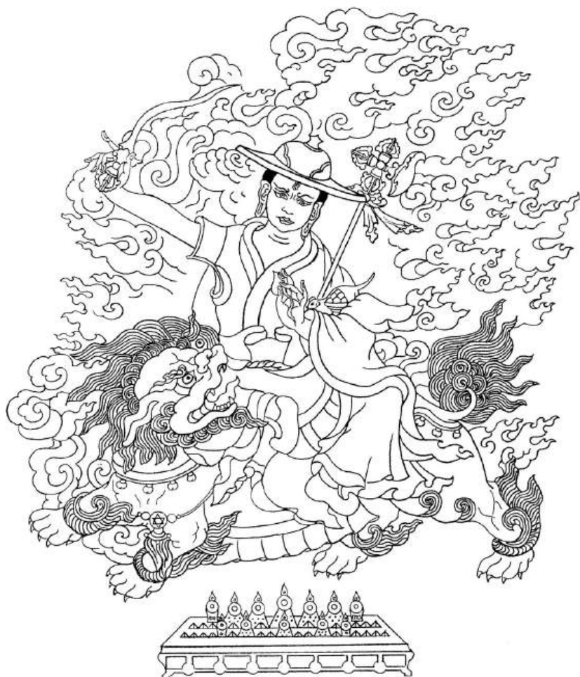
Protetor de Sabedoria do Dharma