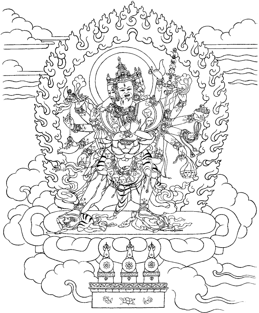
Heruka de Doze Braços