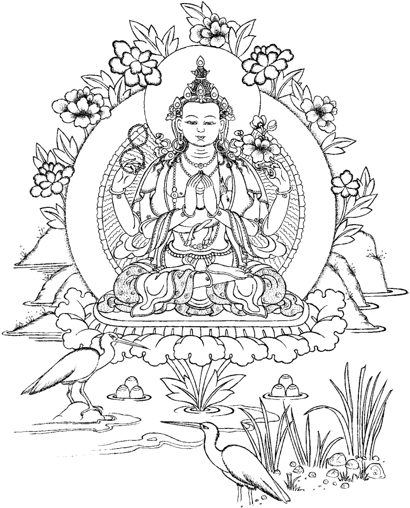
Buda da Compaixão