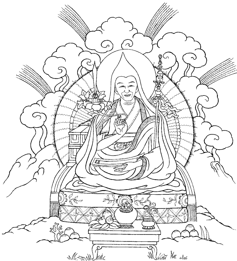
Dorjechang Trijang Rinpoche