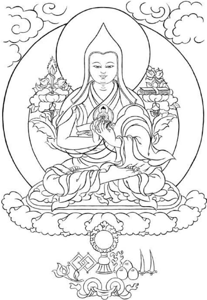
Guru Sumati Buda Heruka