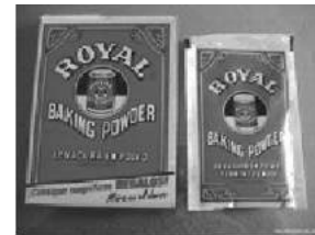
Polvo de hornear o levadura

En la elaboración de postres se utiliza cualquier tipo de fruta, nueces y/o chocolate.