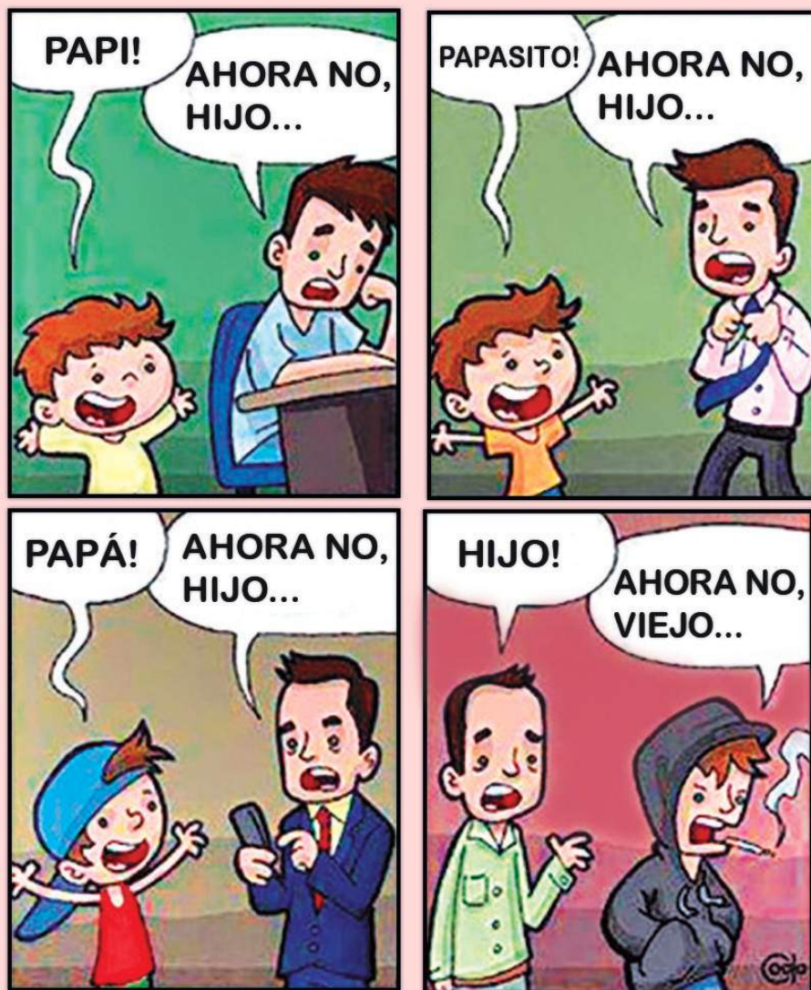
Esta imagen, muestra la conducta de los niños al ver lo que hacen los padres. Sin palabras

Familiares: El niño puede tener actitudes agresivas como una forma de expresar su sentir ante un entorno familiar poco afectivo, donde existen situaciones de ausencia de algún padre, divorcio, violencia, abuso o humillación ejercida por los padres y hermanos mayores; tal vez porque es un niño que posiblemente vive bajo constante presión para que tenga éxito en sus actividades o por el contrario es un niño sumamente mimado.