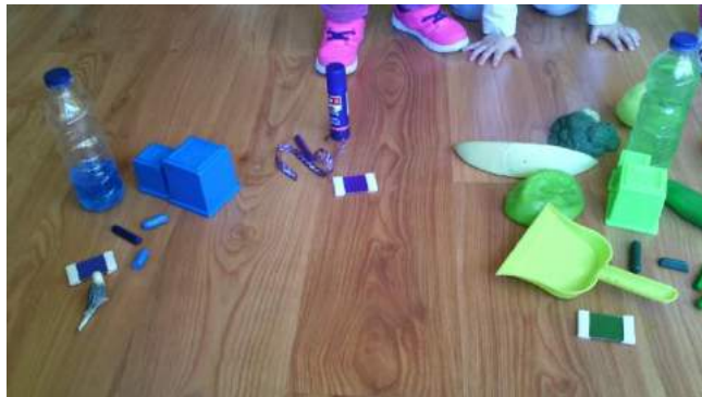
Caja de color