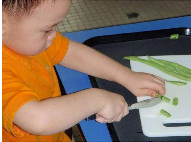
Pelar habas (si quieres ver la actividad completa pincha aquí)