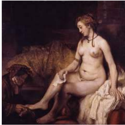
Betsabé en el baño. Rembrandt