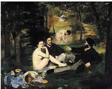
Imagen de Petrusbarbygere en wikimedia bajo dominio público

Posteriormente en el realismo , los artistas pusieron su empeño en la representación del cuerpo humano tal y como lo percibían.