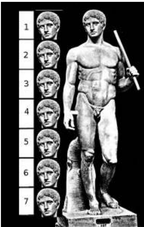
Canon de Policleto. El Doriforo (copia del Museo Arqueológico de Atenas).

La unidad de medida de referencia era la altura de la cabeza. Policleto estableció el canon de siete cabezas como modelo de un cuerpo perfectamente proporcionado. Más tarde Lisipo creó otro canon más esbelto que el anterior aumentándolo a siete cabezas y media.