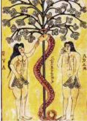
Imagen de Canaan en wikimedia bajo dominio público

En la Edad Media , una época marcada por el cristianismo, el desnudo estaba principalmente representado en escenas de carácter religioso que lo justificaban. En cuanto a la representación, se pierde en naturalismo en favor de la estilización y el contenido simbólico. Importa más el mensaje que transmite la imagen que su parecido con la realidad.