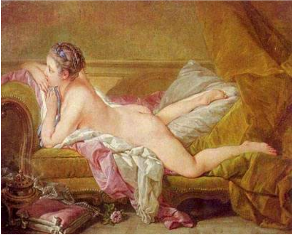
Joven recostada. François Boucher