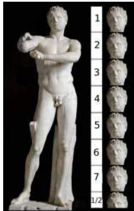
Canon de Lisipo. El Apoxyómeno (copia del Museo Vaticano).