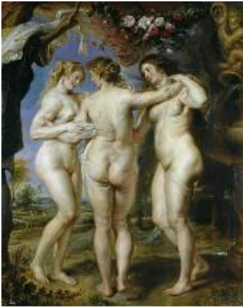
Las Tres Gracias. Rubens