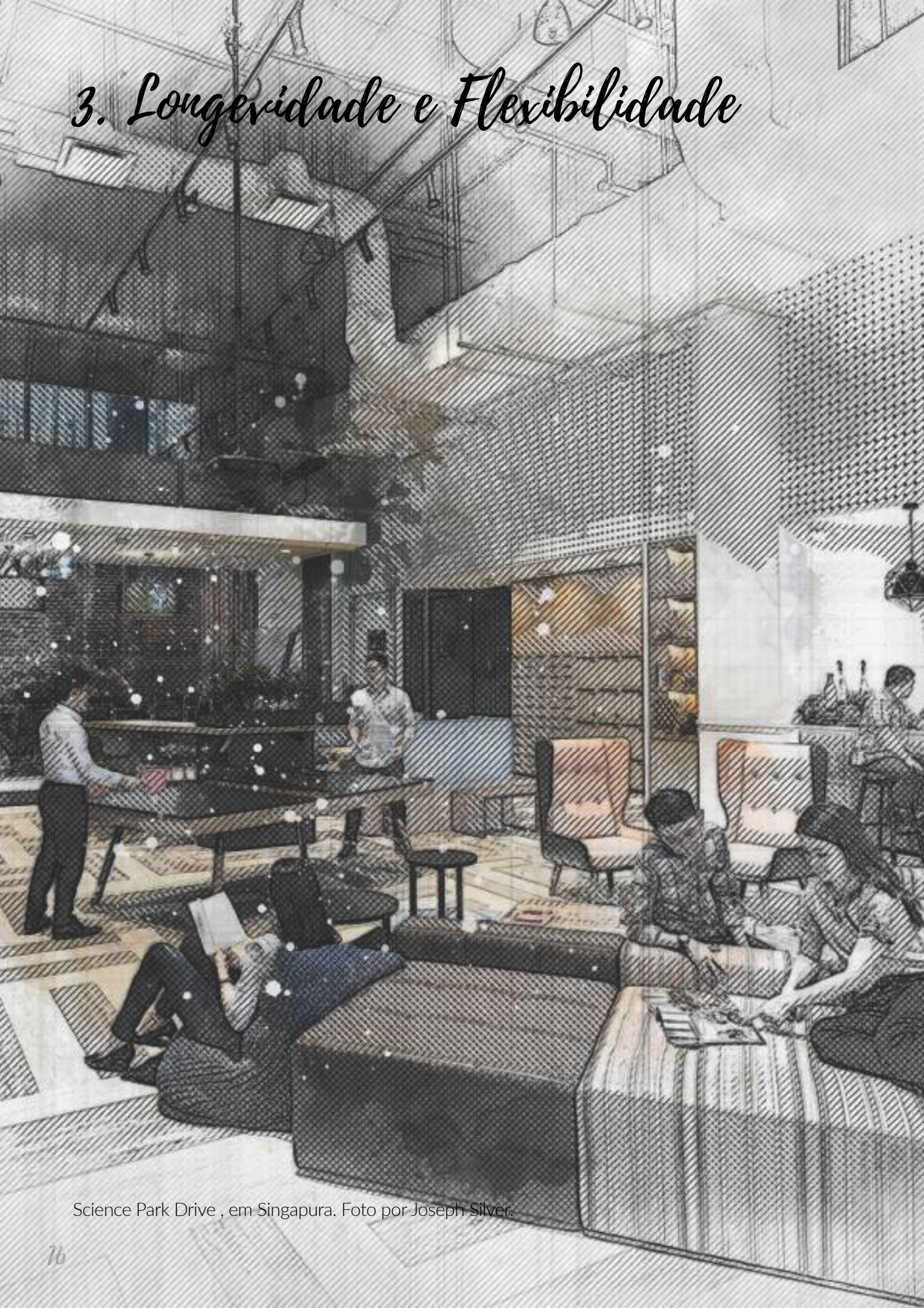
Science Park Drive , em Singapura.