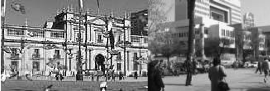
Palacio de la Moneda