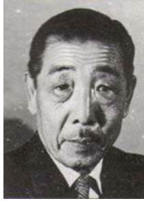
Autor: Yehan Numata