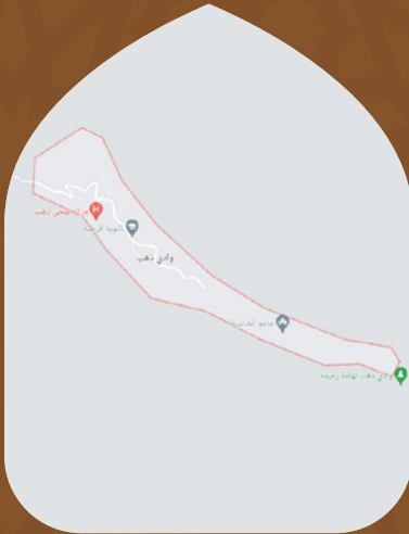
مركز وادي ذهب