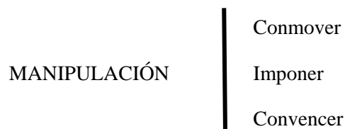
Figura 1: Primera partición del signo manipulación

A diferencia de lo sugerido por la tradición prescriptiva de la argumentación, cada una de estas formas tiene su propia eficacia en la manipulación, y la preeminencia de cada uno de los aspectos supone un énfasis en alguno de ellos, pero de ninguna manera una negación del resto. En tanto constituyentes del signo, necesitan pensarse como interactuantes y dependientes entre sí. En este sentido, el conmover , en tanto Primeridad (CP 1.543) constituye la instancia de posibilidad del signo. La retórica clásica ya señalaba la necesidad de comenzar un discurso con el recurso denominado captatio benevolentiae , el cual permitía una buena predisposición de los destinatarios para el despliegue de la demostración; como posibilidad, una apelación de este tipo necesitará actualizarse en una particular organización de las relaciones entre los participantes, sin la cual la predisposición difícilmente se transforme en adhesión.