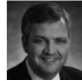
R. Albet Mohler

La sociedad occidental está experimentando actualmente lo que solo puede describirse como una revolución moral. El código moral de nuestra sociedad y la evaluación ética colectiva sobre un tema en particular, no solo han pasado por pequeños ajustes, sino que han sido totalmente revertidos. Aquello que una vez fue condenado, ahora es celebrado y, si nos negamos a celebrar, somos condenados.