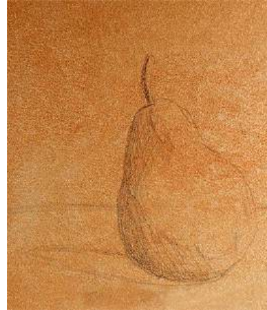
Ilustración 4 Pintura con aguada inicial y dibujo a lápiz

debe usar aceitosa disparejo. iniciales, no amarillo de se debe