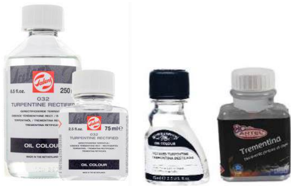
Ilustración 1 Diferentes marcas de trementina