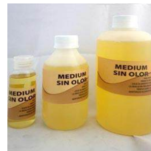
Ilustración 3 Medium sin olor

El médium para oleo es una mezcla de trementina, aceite de linaza y veces una pequeña cantidad de barniz. Es el principal solvente a utilizar proceso de pintar una obra al óleo pues al juntar el disolvente (trementina), con el vehículo (aceite de linaza), otorga a la capa ligereza si perder la capacidad de cubrir. Es la elección cuando estamos de pintar con cantidades mayores de pintura. También es indispensable trabajo de veladuras.