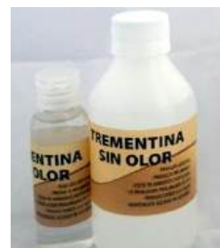
Ilustración 2 Trementina sin olor

Se trata de un producto derivado del petróleo y que permite un trabajo al interior de talleres colectivos como los que se realizan en la municipalidad de Las Condes pues al no tener el olor característico de este genera problemas respiratorios o irritación ocular entre otras molestias. tomando en cuenta que nuestros cursos se realizan principalmente en del año.