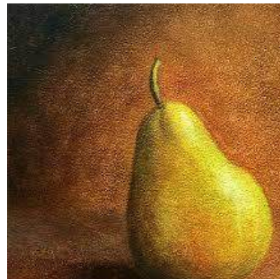
Ilustración 5 La misma pintura anterior, en etapa final, con sus empastes y el modelado de la luz a la sombra